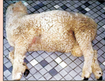
फड़किया से ग्रसित भेड़

यह बकरी व भेड़ में पाया जाने वाला मुख्य जीवाणु जनित रोग है। इसके रोगाणु मूदा एवं पशु की ग्रास नली में अपनी प्राकृतिक अवस्था में पाये जाते हैं। इस बीमारी की चपेट में आए पशु की मृत्यु प्रायः चरते-चरते मौके पर ही अथवा 36 घण्टों के दौरान हो जाती है। इस बीमारी के प्रारम्भिक लक्षण: खाना-पीना छोड़ देना, चक्कर आना तथा खूनी दस्त करना हैं। पशु चारे में परिवर्तन या अत्यधिक मात्रा में भोजन ग्रहण करना इस बीमारी को बढ़ने में सहायता प्रदान करते हैं। इस बीमारी के निम्न उपचार के उपरांत पशु एक सप्ताह में ठीक हो जाता है। पशु के प्रभावित होने पर लगभग आधे कप पानी में लाल दवा के 1 या 2 दाने घोलकर पिला दें। गर्भवती बकरी व भेड़ (गर्भधारण का अन्तिम महीना) तथा 3 महीने से ऊपर के बच्चों का टीका करण करके इस बीमारी से बचा जा सकता है।