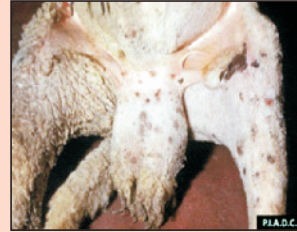
चेचक से ग्रसित भेड़

यह एक विषाणु जनित रोग है जिसमें पशु के मुँह, नाक, थन पर तथा पिछली टागों के मध्य छाले बन जाते हैं। इससे पशु को बहुत खुजली होती है। यह छाले पकने के बाद झड़ जाते हैं तथा उनके निशान बन जाते हैं। लेकिन इस रोग से ग्रसित पशु की मृत्यु नहीं होती है। सही समय पर टीकाकरण ही इसका एक सफल बचाव है।