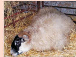
कीटोसिस से ग्रसित भेड़

यह बीमारी उन मादा पशुओं के गर्भकाल की अन्तिम तिमाही में व ब्याने के बाद सम्भावित है, जिनके गर्भ में दो या अधिक भ्रूण विकसित हो रहे हैं अथवा शारीरिक दृष्टि से अत्यधिक कमजोर हैं। ऐसा इन पशुओं में ऊर्जा की कमी, कार्बोहाइड्रेट के उपायचय में गड़बड़ी तथा रक्त में कीटोन पदार्थों का बनना है। पशु के श्वास से एक विशेष प्रकार की मीठी गंध का