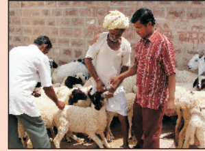
भेड़ों में कृमि नाशक दवा का पिलाना

यह परजीवी इन पशुओं में गम्भीर समस्या पैदा करते हैं। ये इनका रक्त चूसते हैं तथा खनिज लवण व विटामिन की कमी पैदा करते हैं। ऐसा होने से पशु कमजोर हो जाता है, वृद्धि रुक जाती है, गुहा पतली हो जाती है एवं उसमें से बदबू आती है। इन परजीवियों से बचाव के लिए पशुओं को समय-समय पर पशु चिकित्सक की देख-रेख में कृमिनाशक (एल्बेन्डाजोल/फेन्बेन्डाजोल आदि) घोल देना चाहिए। लगभग 250 ग्राम ओक के फूलों को 500 मि.ली. पानी में उबालकर पिलाने से पेट के कीड़े बाहर आ जाते हैं।