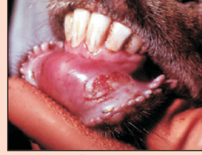
खुरपका-मुँहपका से ग्रसित पशु

यह तीव्रता से फैलने वाली एक विषाणु जनित बीमारी है। इस रोग के मुख्य लक्षणों में मुँह में तथा खुरों के मध्य छाले बनना, लँगड़ा कर चलना, भोजन न करना, तीव्र बुखार एवं गर्भपात आदि हैं। पशु की वृद्धि दर कम हो जाती है। लेकिन मृत्यु बहुत ही कम पशुओं में होती है। इस रोग के विषाणु आपसी स्पर्श व वायु द्वारा फैलते हैं। पशु के मुँह में फिटकरी तथा खुरों पर नीले थोथे का घोल लगाने से पशु को आराम मिलता है। इस बीमारी से ग्रसित होने के पश्चात पशु स्वतः ही ठीक हो जाता है। प्रत्येक छः महीने पश्चात् टीकाकरण ही इस बीमारी से प्रमुख बचाव है।