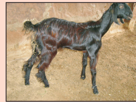
खूनी दस्त से ग्रसित बकरी

यह बीमारी 1 से 4 महीनों के बच्चों में एक अन्तः परजीवी के कारण होती है। इस बीमारी के लक्षणों में तीव्र खूनी-दस्त, भूख न लगना, शारीरिक भार में गिरावट, रक्तहीनता आदि प्रमुख हैं। एक ही बाड़े में सीमित संख्या से अधिक बच्चे व फर्श के गीला होने से इस बीमारी में बढ़ोत्तरी हो जाती है। इससे बचाव के लिए फर्श की सफाई के साथ-साथ खाने व पानी की जगह को भी साफ रखना अति आवश्यक है। पशु चिकित्सक की सलाह से इस रोग हेतु काम आने वाली एम्प्रोलियम व मोनेन्सिन आदि दवाइयों का उपयोग इस बीमारी के बचाव के लिए बरसात के मौसम के पहले किया जा सकता है।