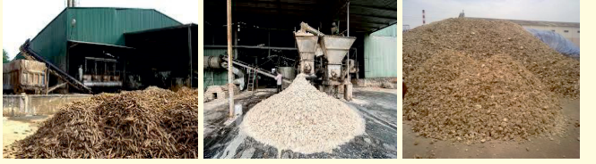
സ്റ്റാർച്ച് ഫാക്ടറിയിൽ നിന്നും പുറംതള്ളപ്പെടുന്ന തിപ്പി എന്ന മരിച്ചിനി വര അവശിഷ്ടം

തിപ്പി ഒൻപതു തരത്തിൽ കമ്പോസ്റ്റിംഗ് ചെയ്യുകയുണ്ടായി. കമ്പോസ്റ്റിംഗിന് ഉപയോഗിക്കുന്ന ഘടകങ്ങൾ, അവയുടെ അളവ്, കമ്പോസ്റ്റിംഗിന് ഉപയോഗിക്കുന്ന