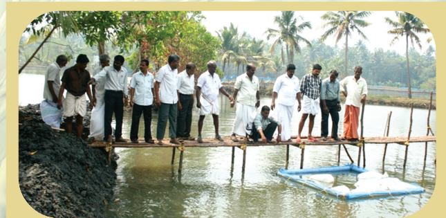
Cage Culture of Fin fishes in Brackish water

Kerala. In order to assess the performance of Maize in farmers field and to assess their response to this new crop, on farm testing of Maize variety Pratap was conducted at 4 locations viz., Karimnalloor, Mookannur, Kumbalangi and Chellanam. In order to promote organic cocconut cultivation through in-situ production of manure, an on farm testing was conducted at 5 locations on production of organic manure in coconut garden . Assessment of effectiveness of neem cake and Ground Nut Cake (GNC) mixture in urban and urban fringe farm was done at thevara.