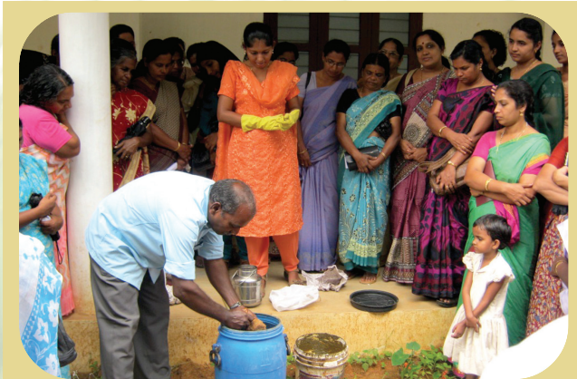
Method demonstration of panchagavya

During the report period, KVK has organized 34 training programmes on various topics wherein 1300 farmers participated. In addition, a short course on Horticultural nursery management was organized exclusively for 2 Self help women groups. Exposure visits to KVK farm was promoted during 2011-12 wherein more than 500 farmers visited and interacted with the scientists.