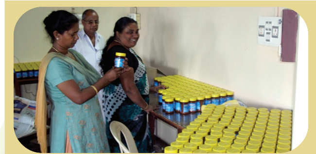
Training on entrepreneurship development : Fish products ready for marketing

KVK ESTABLISHED MARKET LINKAGES AND TEST MARKETED VALUE ADDED PRODUCTS: In order to promote entrepreneurship among fish product