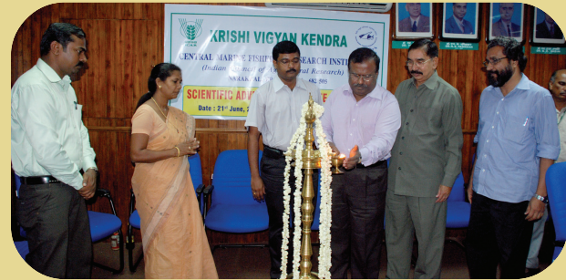
Inauguration of SAC meeting

talk on Horticulture demonstration farm at KVK-Thevara campus was broadcasted by AIR, Kochi on 09-08-2011. A Radio programme on High density planting of banana was broadcasted by AIR, Kochi on 06-10-2011 and 11-12-2011.