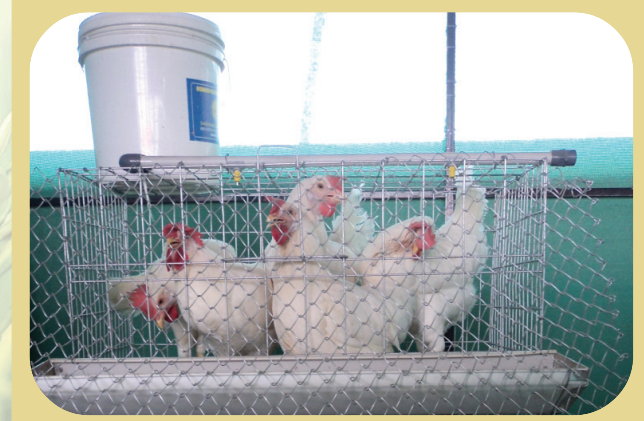
Demonstration of Athulya poultry in cage system

പരിക്ഷണ ശാലകളിലും തോട്ടങ്ങളിലും മറ്റും പരീക്ഷിച്ച് വിജയകരമായ സാങ്കേതിക വിദ്യകൾ കർഷകരുടെ ഇടയിൽ പ്രചരണാർത്ഥം പ്രദർശിപ്പിക്കുവാനുള്ള കൃഷി വിജ്ഞാന കേന്ദ്രങ്ങളുടെ ഒരു പ്രധാന പരിപാടിയാണ് മുൻ നിര പ്രദർശനങ്ങൾ. 2011-12 വർഷത്തിൽ 12 മുൻനിര പ്രദർശനങ്ങളാണ് ഈ കേന്ദ്രം നടത്തിയത്.