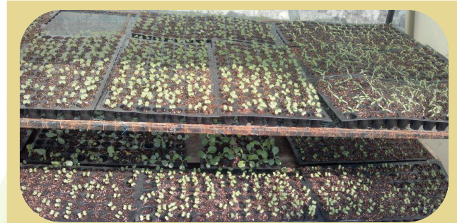
Seedling production in protrays

Seed germination percentage in farmer's field is less due to poor management practices. In order to tackle this problem, KVK has initiated growing seedlings and supplying at transplanting stage. Protray method of seedling raising was followed where the pest and disease incidence is minimum. A green house and net house facilities were created for this purpose.