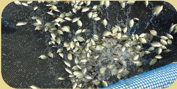
Pearl spot fingerlings in cages

There is huge demand for the seeds of Pearl spot, the state fish of Kerala. In addition to producing seeds in the hatcheries, KVK has also taken steps to collect seeds from wild. In this connection, an FLD on Demonstration of Pearl