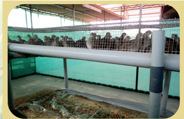
Demonstration of quail rearing at Thevara campus

കർഷകർക്ക് ഗുണനിലവാരമുള്ള മൂയൽ കുഞ്ഞുങ്ങളെ നൽകുന്നതിന് ലക്ഷ്യമിട്ട് കെ.വി.കെ.യിൽ ഒരു മൂയൽ പ്രജനന കേന്ദ്രം ആരംഭിച്ചു. ദേശീയ കാർഷിക ഗവേഷണ കൗൺസിലിന്റെ കൊഡൈക്കനാലിനടുത്ത് മനവന്നുരിലുള്ള ഗവേഷണ കേന്ദ്രത്തിൽ നിന്നാണ് പ്രജനനത്തിലേക്കാവശ്യമായ ബ്രീഡർ മൂയലുകളെ കൊണ്ടുവന്നത്.