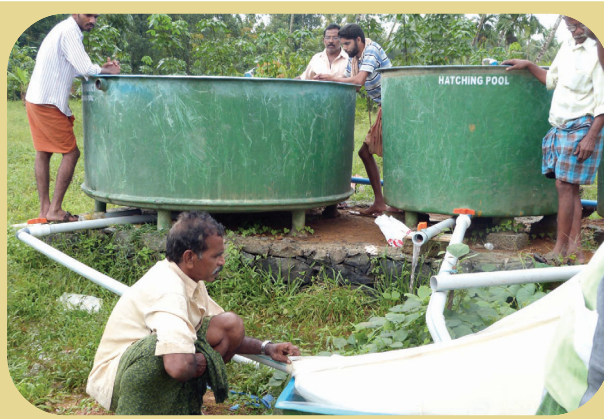
Portable Carp hatchery : Collection of carp eggs from breeding tanks

ഇതിനു പുറമെ കെ.വി.കെ.യുടെ പ്രദർശന തോട്ടം സന്ദർശിക്കാൻ എറണാകുളത്തെ സ്കൂൾ കുട്ടികളുടെ അഭ്യർത്ഥനയോടനുസരിച്ച് തിരക്കാണ് കഴിഞ്ഞ വർഷം അനുഭവപ്പെട്ടത്.