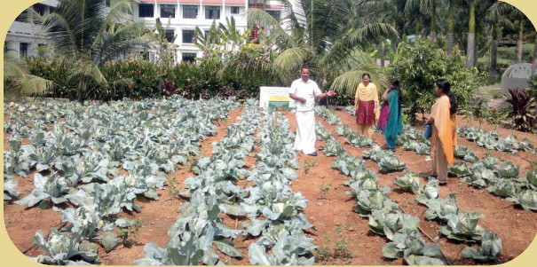
Student participatory farming at FISAT Engg. College

Mazhuvannor panchayats. Nearly 200 farmers attended the programme. Soil health camps were conducted to make awareness among farmers regarding the importance of soil testing. Practical sessions were conducted on soil sampling procedure. The basic objective of soil health camp is to educate farmers on the economic use of fertilizers and better soil management practices for increasing the crop production.