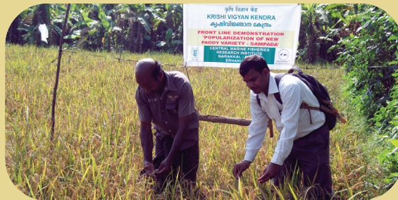
Popularization of new paddy variety- Sampada

and Thevara. Soviet Chinchilla rabbits are known for its meat quality and growth rate. Another FLD was to demonstrate the production potential of Japanese quails, wherein 7 demonstration units each comprising of 50 birds were set up in farmers fields of Kumbalangi and Thevara. Frontline demonstration of revised deworming schedule in calves was conducted at 10 locations in Kumbalangi, Thevara and Vypin. Revised de-worming schedule is for effective management of Toxocarosis in calves, which affect its growth rate.