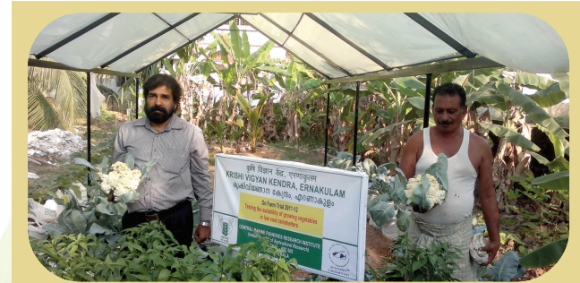
Testing the suitability of growing vegetables in low cost rainshelters

On farm testing is meant for assessing the performance of lab tested technologies in farmers field and also to refine the technologies to suit specific