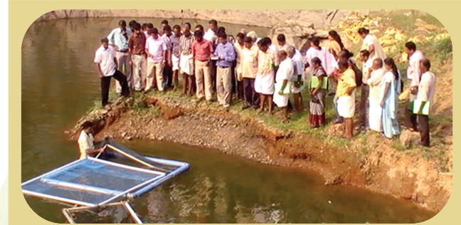
Demonstration of cage installation in Granite Quarries

A Farmer Field School of 7 weeks duration on Small Scale Cage Culture of Brackish Water Candidate Fishes was conducted at Pallipuram. Forty fish farmers from