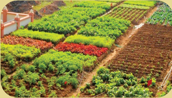
Organic seed production cum demonstration farm

corn, Carrot, Raddish, Cluster bean, Capsicum, French bean, Cabbage, Cauliflower and Amaranthus were grown in organic mode. Crop diary is maintained for compiling the organic farming experiences. The wastes from animal and poultry units are used as manure in this farm.