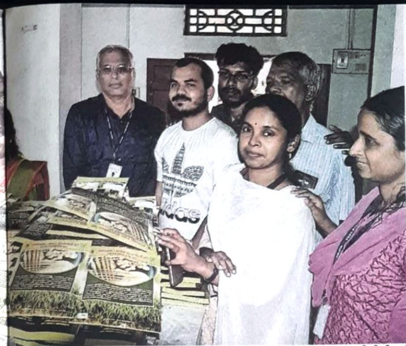
ഉൽപ്പന്നങ്ങളുമായി സിപിസിആർഐയുടെയും കമ്പനിയുടെയും പ്രതിനിധികൾ