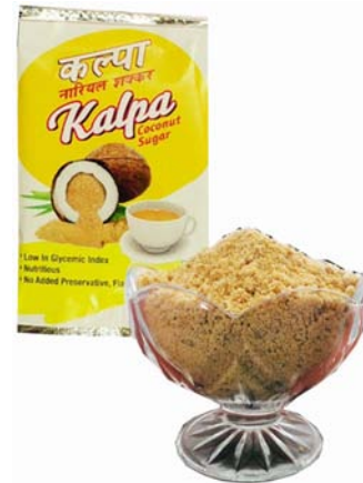
ಚಿತ್ರ 31. ತೆಂಗಿನ ಸಕ್ಕರೆಯ ಪೊಟ್ಟಣ

ಸಿ.ಪಿ.ಸಿ.ಆರ್.ಐ. ತಂತ್ರಜ್ಞಾನ ಮತ್ತು ಸಾಂಪ್ರದಾಯಿಕ ಪದ್ಧತಿಯಿಂದ ಪಡೆದ ಕಲ್ಪರಸದಲ್ಲಿ ಸ್ಪಷ್ಟವಾದ ವ್ಯತ್ಯಾಸವನ್ನು ಕಾಣಬಹುದು. ಸಿ.ಪಿ.ಸಿ.ಆರ್, ಐ ತಂತ್ರಜ್ಞಾನದಿಂದ ಸಂಗ್ರಹಿಸಿದ ಕಲ್ಪರಸವು ಸ್ವಲ್ಪ ಕ್ಷಾರೀಯ ರಸಸಾರ ಹೊಂದಿದ್ದು,