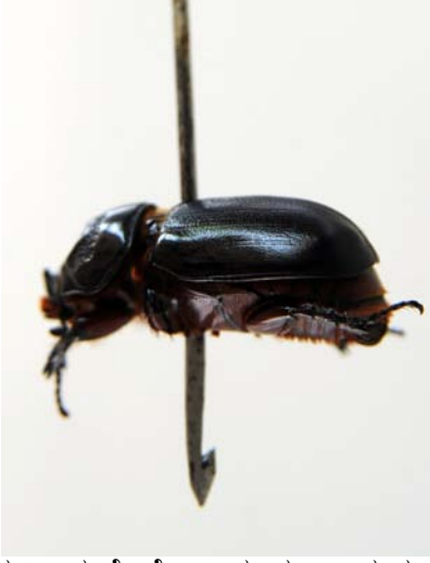
ಕಬ್ಬಿಣದ ಕೊಕ್ಕೆಯಿಂದ ದುಂಬಿಯನ್ನು ಹೊರಗೆಳೆಯುವುದು

ಪ್ರತಿ ಹೆಕ್ಟೇರ್‌ಗೆ ಒಂದರಂತೆ ಬಳಸಬೇಕು. ಚಿಕ್ಕ ವಯಸ್ಸಿನ ತೆಂಗಿನ ಮರವಿರುವ ತೋಟದಲ್ಲಿ ಇದರ ಉಪಯೋಗವನ್ನು ಮಾಡಬಾರದು.