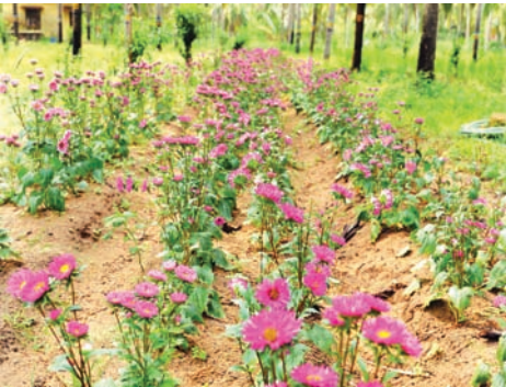
ವ. ಜೈನಾ ಆಸ್ಪರ್ ಹೂ