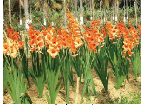
ಬ. ಗ್ಲಾಡಿಯೋಲಸ್ ಹೂ