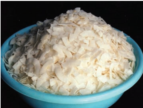
ಚಿತ್ರ 28 ಎ. ತೆಂಗಿನ ಚಿಪ್ಸ್

ಗರಿಗರಿಯಾದ ರುಚಿಕರವಾದ ಪೌಷ್ಟಿಕಾಂಶ ಭರಿತ ಚಿಪ್ಸ್‌ನ್ನು 8-9 ತಿಂಗಳ ತೆಂಗಿನ ಕಾಯಿಯ ತಿರುಳಿನಿಂದ ತಯಾರಿಸಲಾಗುತ್ತದೆ (ಚಿತ್ರ 28). ತೆಂಗಿನ ಕಾಯಿಯ ತಿರುಳನ್ನು 0.75 ಮಿ.ಮೀ. ಗಾತ್ರದ ಸಮನಾದ ತುಂಡುಗಳನ್ನಾಗಿಸಿ, ಉಪ್ಪು ನೀರು ಅಥವಾ ಸಕ್ಕರೆ ದ್ರಾವಣದಲ್ಲಿ ಆಸ್ಮೋಸಿಸ್ ಕ್ರಿಯೆಗೊಳಪಡಿಸಿ ತಯಾರಿಸಲ್ಪಡುವುದರಿಂದ, ಇತರೆ ಚಿಪ್ಸ್‌ಗಳಂತೆ ಎಣ್ಣೆಯಲ್ಲಿ ಕರಿಯುವ ಅಗತ್ಯವಿಲ್ಲ. ಇತ್ತೀಚಿನ ದಿನಗಳಲ್ಲಿ ಲಭ್ಯವಿರುವ ಸಂಸ್ಕರಿಸಿದ ತಿಂಡಿಗಳು ಕಡಿಮೆ ಪೌಷ್ಟಿಕಾಂಶ, ಅತಿ ಹೆಚ್ಚಿನ ಕಾರ್ಬೋಹೈಡ್ರೇಟ್ ಹಾಗೂ ಸಕ್ಕರೆ ಅಂಶ ಹೊಂದಿರುತ್ತವೆ. ಈ ತರಹದ ತಿಂಡಿಗಳನ್ನು ಹೆಚ್ಚಿಗೆ ಸೇವಿಸುವುದರಿಂದ ಹೃದಯದೊತ್ತಡ ಹೆಚ್ಚುವುದೆಂದು ಅಮೆರಿಕನ್ ಹಾರ್ಟ್ ಅಸೋಸಿಯೇಷನ್ ದೃಢಪಡಿಸಿದೆ. ಈ ನಿಟ್ಟಿನಲ್ಲಿ ತೆಂಗಿನ ಚಿಪ್ಸ್ ಒಂದು ಆರೋಗ್ಯ ವರ್ಧಕ ಪರ್ಯಾಯ ಲಘು ಆಹಾರವಾಗಿದೆ.