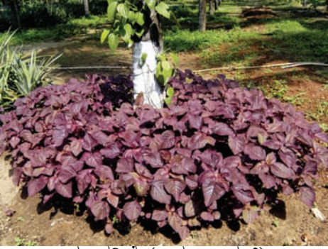
ಡ. ಹರಿವೆ (ಅಮರಾಂಧಸ್)