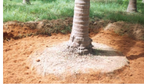
ತೆಂಗಿನ ನಾರಿನ ಹುಡಿ