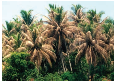
ಕಪ್ಪು ತಲೆ ಹುಳು ಬಾಧಿತ ಮರಗಳು

ಈ ಕೀಟವು 8-10 ವಾರಗಳ ಜೀವನ ಚಕ್ರ ಹೊಂದಿದೆ. ಮರಿ ಹುಳುಗಳ ಹಂತವು 42 ದಿನಗಳ ವರೆಗೆ ಇರುವುದು. ಬೆಳೆದ ಹುಳು ತಿಳಿ ಹಸಿರು ಬಣ್ಣ ಹೊಂದಿದ್ದು, ಕಂದು ಬಣ್ಣದ ಗೆರೆಗಳನ್ನು ಹೊಂದಿರುತ್ತದೆ. ಕಪ್ಪು ತಲೆಯ ಈ ಹುಳು ತನ್ನ ನೂಲಿನ ಗೂಡಿನಲ್ಲಿ ಕೋಶಾವಸ್ಥೆ ಕಳೆದು ಹೊರಬಂದ ಪತಂಗ ಬೂದು ಬಣ್ಣ ಹೊಂದಿರುತ್ತದೆ. ವಿಶೇಷವಾಗಿ