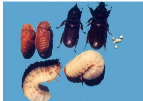
ಕುರುವಾಯಿ ದುಂಬಿ ಮರಿ ಹುಳು

ಈ ಕೀಟವು ಎಲ್ಲಾ ವಯಸ್ಸಿನ ಗಿಡಗಳಿಗೆ ಹಾನಿ ಮಾಡುತ್ತದೆ. ಇವುಗಳು ಎಲೆಗಳ ಸುಳಿಗಳ ಹಾಗೂ ಹೊಂಬಾಳೆಯ ಮೃದುವಾದ ಅಂಗಾಂಶಗಳನ್ನು ಕೊರೆದು ತಿಂದು, ನಾರಿನಂತಹ ಪದಾರ್ಥವನ್ನು ಹೊರಹಾಕುವುದರಿಂದ ಗಿಡದ ತುದಿ ಮೊಗ್ಗು, ಚಿಗುರೆಲೆಗಳು ತಿರುಚಿ, ವಿರೂಪಗೊಂಡು, ಗಿಡವು ಗಮನಾರ್ಹ ನಷ್ಟ ಹೊಂದುತ್ತದೆ (ಚಿತ್ರ 13). ಹಾನಿಗೀಡಾದ ಚಿಗುರೆಲೆಗಳು ಅರಳಿದ ಮೇಲೆ, ವಿಶಿಷ್ಟವಾದ 'V' ಆಕಾರದಲ್ಲಿ ಬೀಸಣಿಕೆಯಂತೆ ಕಾಣಿಸಿಕೊಳ್ಳುತ್ತವೆ. ಈ ಕೀಟ ಬಾಧೆಗೊಳಗಾದ ಗಿಡದ ಹೊಂಬಾಳೆಯಲ್ಲಿ ರಂಧ್ರ ಕಾಣಿಸಿಕೊಂಡು, ಪೂರ್ತಿಯಾಗಿ ಒಣಗಿ ಕಾಯಿಗಳು ನಾಶವಾಗುತ್ತವೆ. ಗಿಡದ