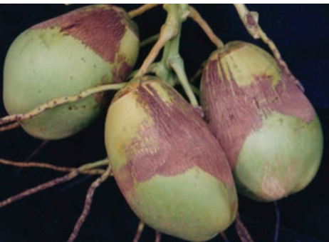
ಚಿತ್ರ 16. ನುಸಿ ಬಾಧಿತ ತೆಂಗಿನ ಕಾಯಿ

ನುಸಿ ಕೀಟದ ಜೀವನ ಚಕ್ರವು 7-10 ದಿನಗಳಲ್ಲಿ ಪೂರ್ತಿಯಾಗುವುದು. ನೀಳವಾದ ಬಿಳಿ ಬಣ್ಣದ ಈ ಕೀಟವು ಸೂಕ್ಷ್ಮದರ್ಶಕದ ಮೂಲಕ ಮಾತ್ರ ನಮ್ಮ ಕಣ್ಣಿಗೆ ಕಾಣಿಸುತ್ತದೆ. ಹೆಣ್ಣು ನುಸಿ ಕೀಟ 200-250 ಮೈಕ್ರಾನ್ ಉದ್ದ ಮತ್ತು 36-52 ಮೈಕ್ರಾನ್ ಅಗಲವಿದೆ. ಈ ಕೀಟದ ತಲೆ ಭಾಗದಲ್ಲಿ ಸೂಜಿ ಮೊನೆಯಾಕಾರದ ಬಾಯಿ ಮತ್ತು ಹೊಟ್ಟೆಯ ಭಾಗದಲ್ಲಿ ಎರಡು ಜೋಡಿ ಕಾಲುಗಳಿವೆ. ಇದರ ಮೇಲ್ಮೈಯಲ್ಲಿ ಸಾಲಾಗಿರುವ ಹರಿತ ರೋಮಗಳಿವೆ. ಹೆಣ್ಣು ನುಸಿ ಕೀಟವು ತನ್ನ ಜೀವನ ಕಾಲದಲ್ಲಿ 100-150 ಮೊಟ್ಟೆಯಿಡುತ್ತದೆ. ಈ ನುಸಿಯ ವಿವಿಧ ಜೀವನ ಹಂತಗಳನ್ನು ಹೂವಿನ ದಳಗಳು ಮತ್ತು ಕೋಮಲ ಭಾಗಗಳಲ್ಲಿ ಕಾಣಬಹುದು. ಈ ಕೀಟವು ಗಾಳಿಯ ಮುಖಾಂತರ ಹರಡುತ್ತದೆ. ಈ ಕೀಟವು ಇಡೀ ವರ್ಷ ಹಾನಿಮಾಡಿದರೂ, ಬೇಸಿಗೆ ಕಾಲದಲ್ಲಿ ಅಧಿಕ ಸಂಖ್ಯೆಯಲ್ಲಿ ಕಾಣಬರುತ್ತದೆ.