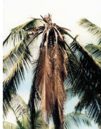
ಸುಳಿ ಕೊಳೆ ರೋಗದಿಂದ ಸತ್ತ ತೆಂಗಿನ ಮರ