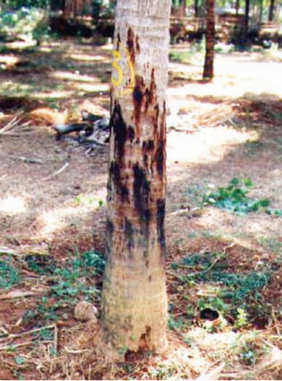
ಚಿತ್ರ 19. ತೆಂಗಿನ ಕಾಂಡ ಸೋರುವ ರೋಗ

ವೊದಲಿಗೆ ಕಾಂಡದ ಕೆಳಭಾಗದಲ್ಲಿ ತೊಗಟೆಯಿಂದ ದಟ್ಟ ಕೆಂಪು ಮಿಶ್ರಿತ ಕಂದು ಬಣ್ಣದ ದ್ರವವು ಹೊರ ಸೂಸುತ್ತದೆ. ಹತ್ತಿರದ ಈ ರೀತಿಯ ಒಂದೆರಡು ಮಚ್ಚೆಗಳು ಕೂಡಿಕೊಂಡು, ಅಗಲವಾದ ರಕ್ತ ಕಾರಿದ ಕಲೆಗಳು ಕಾಂಡದಲ್ಲಿ ಉಂಟಾಗುತ್ತವೆ (ಚಿತ್ರ 19). ಹೀಗೆ ಹೊರ ಸೂಸುವ ದ್ರವವು ಒಣಗಿ ಕಪ್ಪು ಬಣ್ಣಕ್ಕೆ ತಿರುಗುತ್ತದೆ. ಹೊರ ಭಾಗದ ತೊಗಟೆಯ ಒಳಗಿರುವ ಅಂಗಾಂಶಗಳು ದ್ರವ ಹೊರ ಸೂಸುವುದರಿಂದ ಸ್ವಾಭಾವಿಕವಾಗಿ ತನ್ನ ಬಣ್ಣವನ್ನು ಕಳೆದುಕೊಳ್ಳುತ್ತವೆ. ಈ