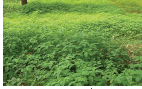
ಟ. ಮುಳ್ಳಿಲ್ಲದ ನಾಚಿಗೆಗಿಡ (ಮೈಮೊಸ ಇನ್‌ವೈಸಾ)

ಇನ್‌ವೈಸಾ) ಮತ್ತು ಕಲಪಗೊನಿಯಮ್ ಮ್ಯೂಕನೋಯ್ಡ್ಸ್ (ಚಿತ್ರ 2) ತೆಂಗಿನ ತೋಟದಲ್ಲಿ ಉಪಯೋಗಿಸುವ ಉತ್ತಮ ಹೊದಿಕೆ ಬೆಳೆಗಳಾಗಿವೆ. ಇವುಗಳು ಸುಮಾರು 15-25 ಕೆ.ಜಿ. ಜೀವರಾಶಿಯನ್ನು ಹಾಗೂ 100-200 ಗ್ರಾಂ. ಸಾರಜನಕವನ್ನು 140-150 ದಿವಸಗಳಲ್ಲಿ ಉತ್ಪಾದಿಸುತ್ತವೆ.