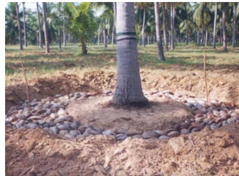
ತೆಂಗಿನ ಸಿಪ್ಪೆ ಚಿತ್ರ 6. ಹೊದಿಕೆ