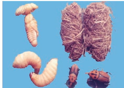
ಕೆಂಪು ಮೂತಿ ದುಂಬಿ

ಹೆಣ್ಣು ಜೀರುಂಡೆ ಕಾಂಡದ ಮೃದು ಭಾಗದಲ್ಲಿ ಸಣ್ಣ ರಂಧ್ರ ಕೊರೆದು ಮೊಟ್ಟೆ ಇಡುವುದು. ಇವುಗಳು ತಮ್ಮ ಜೀವನ ಕಾಲದಲ್ಲಿ ಅಂದಾಜು 175 ಮೊಟ್ಟೆ ಇಡುತ್ತವೆ. ಎರಡರಿಂದ ಮೂರು ದಿನಗಳು ಕಳೆದು, ಮೊಟ್ಟೆಯಿಂದ ಹೊರಬಂದ ಕಾಲಿಲ್ಲದ ಬಿಳಿ ಬಣ್ಣದ ಮರಿ ಹುಳುಗಳು ಮರದ ಮೃದು ಭಾಗ ಕೊರೆದು ತಿನ್ನುತ್ತ ಅಭಿವೃದ್ಧಿಗೊಳ್ಳುವುದರಿಂದ, ಮರದಿಂದ ಕೆಂಪು ಬಣ್ಣದ ನಾರು ಹೊರಸೂಸುತ್ತದೆ. ಹೊರಸೂಸಿದ ನಾರಿನಿಂದ ಮಾಡಲ್ಪಟ್ಟ ಕೋಶದೊಳಗೆ 12-20 ದಿವಸಗಳ ಕೋಶಾವಸ್ಥೆ ಕಳೆಯುತ್ತವೆ. ಈ ಕೀಟವು ತನ್ನ ಜೀವನ ಚಕ್ರ (ಮೊಟ್ಟೆಯಿಂದ ಪ್ರೌಢ ಕೀಟದ ಹಂತ)ವನ್ನು ನಾಲ್ಕು ತಿಂಗಳಲ್ಲಿ ಪೂರೈಸಿಕೊಳ್ಳುತ್ತದೆ.