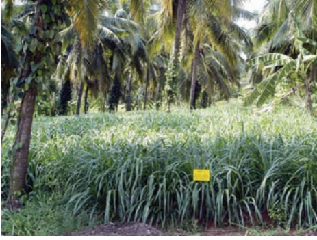
ಅ. ತೆಂಗು + ಕಾಳು ಮೆಣಸು + ಮೇವಿನ ಹುಲ್ಲು