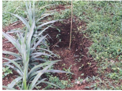
ಚಿತ್ರ 8. ಸಂಗ್ರಹ ಗುಂಡಿ

ತೆಂಗು ಬೆಳೆಯ ಮಧ್ಯದಲ್ಲಿ 1.5 x 0.5 x 0.5 ಮೀ. (ಉದ್ದ x ಅಗಲ x ಆಳ) ಇರುವ ಗುಂಡಿಗಳನ್ನು ತೋಡಬೇಕು. (ತೆಂಗಿನ ಅಂತರದಲ್ಲಿ 2 ಗುಂಡಿಗಳನ್ನು ತೋಡಬಹುದು) (ಚಿತ್ರ 8). ಈ ರೀತಿಯ ಗುಂಡಿಯ ಪಕ್ಕದಲ್ಲಿ ಅಂತರ ಬೆಳೆಗಳನ್ನು ಬೆಳೆಯಬಹುದು. ಈ ಗುಂಡಿಯಲ್ಲಿ ತೆಂಗಿನ ಸಿಪ್ಪೆಯನ್ನು ಸಹ ಹಾಕಬಹುದು.