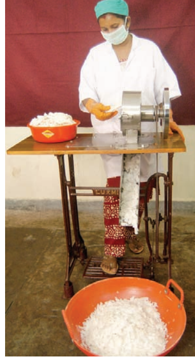
ಚಿತ್ರ 28. ತೆಂಗಿನ ಚಿಪ್ಸ್ ಯಂತ್ರ

ಗಮನಾರ್ಹ ಪ್ರಮಾಣದ ಕಾರ್ಬೋಹೈಡ್ರೇಟ್, ಸಸ್ಯ ಪ್ರೋಟೀನ್ ಮತ್ತು ನಾರಿನಾಂಶ ಲಭ್ಯವಿರುವ ತೆಂಗಿನ ತಿರುಳಿನಿಂದ ತೆಂಗಿನ ಚಿಪ್ಸ್ ತಯಾರಿಸಲಾಗುತ್ತದೆ. 100 ಗ್ರಾಂ ತೆಂಗಿನ ಚಿಪ್ಸ್, ಸುಮಾರು 1.5 ಪ್ರತಿಶತ ತೇವಾಂಶ, 45 ಪ್ರತಿಶತ ಕೊಬ್ಬು, 2 ಪ್ರತಿಶತ ಪ್ರೋಟೀನ್, 40 ಪ್ರತಿಶತ ಸಕ್ಕರೆ, 6.5 ಪ್ರತಿಶತ ನಾರಿನಾಂಶ, 1.5 ಪ್ರತಿಶತ ಬೂದಿ ಹೊಂದಿದ್ದು, ಸುಮಾರು 622 ಕ್ಯಾಲರಿ ಶಾಖವನ್ನು ಒದಗಿಸುತ್ತದೆ.