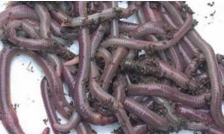
ಯುಡ್ರಿಲಿಸ್ ಸ್ಪಿ. ಎರೆಹುಳು