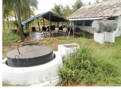
ಬ. ಜೈವಿಕ ಅನಿಲ+ಹಸು ಸಾಕಣೆ