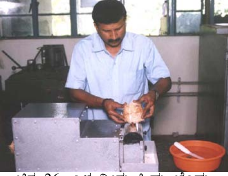
ಚಿತ್ರ 26. ಎಳ ನೀರು ಹಿಮ ಚೆಂಡು ಯಂತ್ರ

ಕಪ್ಪಾಗಿರಬಾರದು. ಮೊದಲಿಗೆ ಎಚ್ಚರದಿಂದ ಯಂತ್ರದ ಮೂಲಕ ಗರಟೆಯನ್ನು ಸುತ್ತಲೂ ಕತ್ತರಿಸಿಕೊಳ್ಳಬೇಕು. ನೈಲಾನಿನ ಬಾಗುವ ಚೂರಿಯಂತಹ ಉಪಕರಣ ತೂರಿ ಕೆಳಗಿನ ಚಿಪ್ಪನ್ನು ಪ್ರತ್ಯೇಕಿಸುವುದು ಮುಂದಿನ ಘಟ್ಟ ಅನಂತರ ಮೇಲಿನ ಚಿಪ್ಪು ಬಿಳಿ ಚೆಂಡಿನ ಸುತ್ತಲೂ ಇರುವ ಕಂದು ಪದರಗಳನ್ನು ಲಘುವಾಗಿ ಕಿತ್ತಿ ಬಿಟ್ಟರೆ ಮುಗಿಯಿತು. ಎಳನೀರು ಸುಲಿದು ಹಿಮಚೆಂಡಾಗಿ ರೂಪ ಪಡೆಯಿತು. ಚಿಪ್ಪಿನಲ್ಲಿ ರಂಧ್ರ ಮಾಡುವಾಗ ಎಷ್ಟು ಆಳಬೇಕೆಂಬುದನ್ನು ಅನುಸರಿಸಬಹುದಾಗಿದೆ. ಈ ಯಂತ್ರವನ್ನು ಬಳಸಿ ಅವಿದ್ಯಾವಂತರೂ ಸಹ 5 ನಿಮಿಷದಲ್ಲಿ ಒಂದು ಸ್ಕೂಬಾಲ್ ಎಳನೀರನ್ನು ತಯಾರಿಸಬಹುದು. ಅನುಭವವಾದ ಮೇಲೆ ಕೇವಲ 3 ನಿಮಿಷ ಇದಕ್ಕೆ ಸಾಕಾಗುತ್ತದೆ.