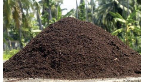
ಎರೆ ಹುಳು ಗೊಬ್ಬರ