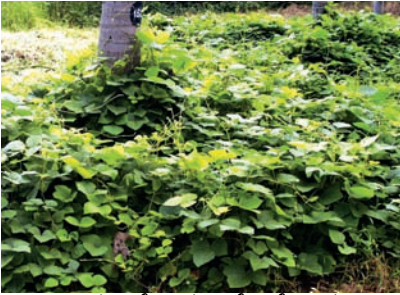
ಅ. ಪ್ಯೂರಿಯ ಫೆಸಿಲೋಯ್ಡ್ಸ್