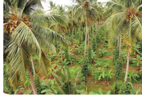
ಚಿತ್ರ 11. ತೆಂಗಿನ ತೋಟದಲ್ಲಿ ಹೆಚ್ಚು ಸಾಂದ್ರತೆಯ ಬೆಳೆ ಪದ್ಧತಿ