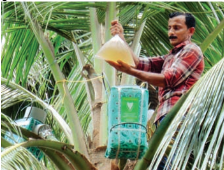
ಚಿತ್ರ 29. ಕೊಕೊ ಸ್ಟ್ರಾಪ್ ಚಿಲ್ಲರ್

ಕೊಕೊ ಸ್ಟ್ರಾಪ್ ಚಿಲ್ಲರ್ ಒಂದು ಪೊಳ್ಳಾದ ಪಿವಿಸಿ ಪೈಪ್, ಇದರ ಒಂದು ತುದಿಯು ಸಸ್ಯರಸವನ್ನು ಸಂಗ್ರಹಿಸಲು ಮಂಜುಗಡ್ಡೆ ತುಂಡುಗಳಿಂದ ಆವರಿಸಿದ 2 ಲೀ. ಸಾಮರ್ಥ್ಯದ ಕಂಟೇನರ್‌ನ್ನು ಇಡುವ ಪೆಟ್ಟಿಗೆಯಲ್ಲಿ ಸೇರುತ್ತದೆ ಮತ್ತು ಇನ್ನೊಂದು ತುದಿಯು ಕಂಟೇನರ್‌ನ್ನು ಸುಲಭವಾಗಿ ಇಡುವಂತೆ ಮತ್ತು ಹೊರತೆಗೆಯಲು ಸಾಧ್ಯವಾಗುವಂತೆ ಅಗಲವಾಗಿರುವ ದ್ವಾರವನ್ನು ಹೊಂದಿದ ಒಂದು ಪೊರ್ಟೆಬಲ್ ಸಾಧನ. ಈ ಪಿವಿಸಿ ಪೈಪ್‌ನ ಹೊರಗೋಡೆಗೆ (ಹೂಗೊಂಚಲು