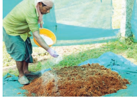
ಚಿತ್ರ 5. ತೆಂಗಿನ ನಾರಿನ ಕಾಂಪೋಸ್ಟ್

ನಾರಿನ ಹುಡಿಯು ನಾರು ಉದ್ದಿಮೆಯಲ್ಲಿ ಸುಲಭವಾಗಿ ದೊರೆಯುವ ಕಚ್ಚಾವಸ್ತು. ಇದು ಹೆಚ್ಚು ನೀರು ಹಿಡಿದಿಡುವ ಸಾಮರ್ಥ್ಯ ಹೊಂದಿದ್ದರೂ, ಕಚ್ಚಾ ರೂಪದ ನಾರಿನ ಹುಡಿಯು ಉತ್ತಮ ಗೊಬ್ಬರವಲ್ಲ. ಇದಕ್ಕೆ ಕಾರಣ ಇದರಲ್ಲಿರುವ ಹೆಚ್ಚಿನ ಪ್ರಮಾಣದ ಪಾಲಿಫಿನಾಲ್ ಅಂಶ ಮತ್ತು ಹೆಚ್ಚಿನ ಸಾರಜನಕ ಇಂಗಾಲದ ಅನುಪಾತ (108:1). ಸಿ.ಪಿ.ಸಿ.ಆರ್.ಐ.ನಲ್ಲಿ ಈ ದಿಸೆಯಲ್ಲಿ ಸಂಶೋಧನೆ ನಡೆಸಿ ಪರಿಹಾರ ಕಂಡುಕೊಳ್ಳಲಾಗಿದೆ. ನಾರಿನ ಹುಡಿಯನ್ನು