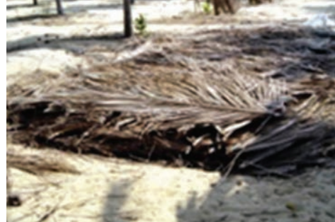
ತೆಂಗಿನ ತೋಟದ ಗುಂಡಿಯಲ್ಲಿ