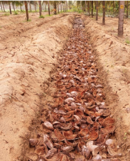
ಚಿತ್ರ 7. ಗುಂಡಿಯಲ್ಲಿ ತೆಂಗಿನ ಸಿಪ್ಪೆ ತುಂಬಿಸುವುದು

ತೆಂಗಿನ ಬುಡದಲ್ಲಿ ಕಾಂಪೋಸ್ಟ್ ಮಾಡಿದ ನಾರಿನ ಹುಡಿಯನ್ನು 10 ಸೆ.ಮೀ. ದಪ್ಪದ ಪದರದಲ್ಲಿ (50 ಕೆ.ಜಿ/ಮರಕ್ಕೆ) ಹಾಕುವುದು ಸಹ ಒಂದು ಪರಿಣಾಮಕಾರಿ ತಂತ್ರಜ್ಞಾನವಾಗಿದೆ. ಇದು ಮಣ್ಣಿನ ಭೌತಿಕ ಗುಣವನ್ನು ಸುಧಾರಿಸಿ, ತೇವಾಂಶ ಹಿಡಿದಿಟ್ಟುಕೊಳ್ಳುವ ಸಾಮರ್ಥ್ಯ ಹೆಚ್ಚಿಸುವುದರಿಂದ ತೆಂಗಿನ ಇಳುವರಿ ಸಹ ಹೆಚ್ಚಿಸುತ್ತದೆ. ಒಂದು ಸಾರಿ ಇದನ್ನು ಹಾಕಿದಾಗ ಸುಮಾರು 4-5 ವರ್ಷಗಳ ವರೆಗೆ ಬಾಳಿಕೆ ಬರುವುದು. ಸಂಪೂರ್ಣವಾಗಿ ಒಣಗಿದ ಕಳೆಯನ್ನು ಸಹ ಮುಚ್ಚಿಗೆ ಮಾಡಲು ಉಪಯೋಗಿಸಬಹುದು.