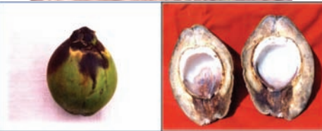
ಚಿತ್ರ 23. ಕಾಯಿ ಕೊಳೆ ಬಾಧಿತ ಮರ

ದ್ರಾವಣ ಅಥವಾ ಶೇ.0.1ರ ಕಾರ್ಬೆಂಡಾಜಿಮ್ ಎರಡು ಸಾರಿ 40 ದಿನಗಳ ಅಂತರದಲ್ಲಿ ಗೊನೆಯ ಮೇಲೆ ಸಿಂಪಡಿಸಿದರೆ ರೋಗವನ್ನು ನಿಯಂತ್ರಿಸಬಹುದು. ಉದುರಿದ ಚಿಕ್ಕ ಮತ್ತು ಇನ್ನೂ ಬಲಿಯದ ಕಾಯಿಗಳನ್ನು ಸಂಗ್ರಹಿಸಿ ಸುಟ್ಟು ಹಾಕಬೇಕು. ತೆಂಗು ಬೆಳೆಯಲ್ಲಿ ಸಾವಯವ ಕೃಷಿ ಪದ್ಧತಿಯನ್ನು ಅನುಸರಿಸಿದ್ದಲ್ಲಿ ಶೇ. 10 ಬೆಳ್ಳೆಳ್ಳಿ ಕಷಾಯವನ್ನು ಬಳಸಬೇಕು.