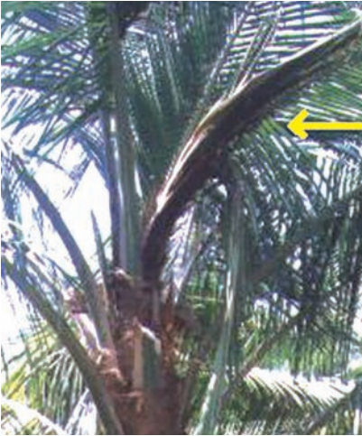
ಚಿತ್ರ 18. ಆರಂಭದ ಹಂತದಲ್ಲಿನ ಸುಳಿ ಕೊಳೆ ರೋಗ

ಸುಳಿಯು ಸೊರಗಿದಾಗಲೇ ರೋಗವನ್ನು ಗುರುತಿಸಿದ್ದೇ ಆದರೆ ರೋಗ ತಗುಲಿದ ಭಾಗವನ್ನು ಸಂಪೂರ್ಣವಾಗಿ ತೆಗೆದು ಹಾಕಿ, ಸ್ವಚ್ಛಗೊಳಿಸಿ ಬೋರ್ಡೋಪೇಸ್ಟನ್ನು ಬಳಿಯಬೇಕು. ಆ ಬಳಿಕ ಈ ಭಾಗವನ್ನು ಮುಚ್ಚಿಟ್ಟು ಮಳೆಗಾಲದಲ್ಲಿ ಈ ಪೇಸ್ಟ್ ತೊಳೆದು ಹೋಗದಂತೆ ರಕ್ಷಿಸಬೇಕು. ತೀವ್ರ ಸ್ವರೂಪದ ರೋಗ ತಗುಲಿದ ಗಿಡಗಳನ್ನು ಕಡಿದು ಸುಡಬೇಕು. ಉಳಿದ ಗಿಡಗಳಿಗೆ ಈ ರೋಗವು ಹರಡದಂತೆ ಪೂರ್ವ ಯೋಜಿತ ನಿಯಂತ್ರಣಕ್ಕಾಗಿ ಶೇ. 1 ರ ಬೋರ್ಡೋದ್ರಾವಣವನ್ನು ಸಿಂಪಡಿಸಬೇಕು