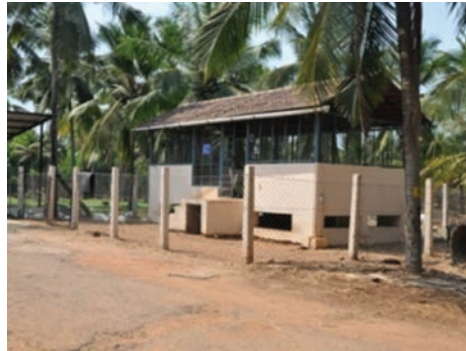
ಚ. ಮೇಕೆ ಸಾಕಣೆ