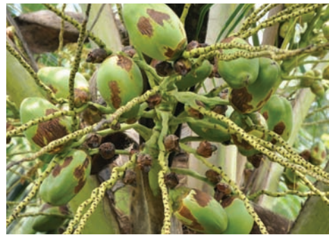
ನುಸಿ ಬಾಧಿತ ಗೊನೆ

4. 200 ಮಿ.ಲೀ. ತಾಳೆ ಎಣ್ಣೆ, 5 ಗ್ರಾಂ ಗಂಧಕ ಮತ್ತು 12 ಗ್ರಾಂ ಸಾಬೂನು ಒಂದು