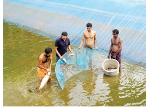
ಕ. ಮೀನು ಸಾಕಣೆ