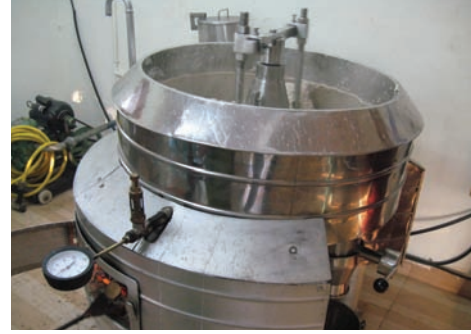
ಚಿತ್ರ 27 ಕೃಷಿ ತ್ಯಾಜ್ಯವನ್ನು ಇಂಧನವಾಗಿ ಉಪಯೋಗಿಸುವ ಯಂತ್ರ

ತಾಜಾ ಬಲಿತ ತೆಂಗಿನ ತಿರುಳಿನಿಂದ ಯಾಂತ್ರಿಕವಾಗಿ ಅಥವಾ ಸಹಜವಾಗಿ, ಶಾಖದ ಬಳಕೆಯಿಂದ ಅಥವಾ ಯಾವುದೇ ರಾಸಾಯನಿಕ ಸಂಸ್ಕರಣೆ ಇಲ್ಲದೇ, ಬ್ಲೀಚಿಂಗ್ ಉಪಯೋಗಿಸದೇ, ನೈಸರ್ಗಿಕ ಸುವಾಸನೆ ಮತ್ತು ಪೋಷಕಾಂಶಗಳನ್ನು ಕಾಪಾಡಿಕೊಂಡ ಎಣ್ಣೆಯೇ ವರ್ಜಿನ್ ತೆಂಗಿನ ಎಣ್ಣೆ. ಇದು ಮಧ್ಯಮ ಸರಣಿಯ ಕೊಬ್ಬಿನ ಅಥವಾ ಆಮ್ಲವನ್ನು ಹೊಂದಿದ ಪ್ರಮುಖವಾಗಿ ಲಾರಿಕ್ ಆಸಿಡ್ ಮತ್ತು ಇದು ಖನಿಜಗಳು, ಜೀವಸತ್ವಗಳು, ಉತ್ಕರ್ಷಣ ನಿರೋಧಕಗಳ ನಿಧಿಯಾಗಿದ್ದು ಉತ್ತಮ ಪೌಷ್ಟಿಕ ಔಷಧಾಹಾರ