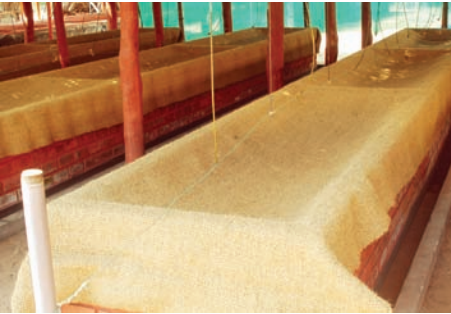
ಚಿತ್ರ ಅ. ಸಿಮೆಂಟ್ ತೊಟ್ಟಿಯಲ್ಲಿ

ಇತ್ತೀಚಿನ ದಿನಗಳಲ್ಲಿ ಎರೆಹುಳುಗಳಿಂದ ತಯಾರಾದ ಎರೆಹುಳು ಗೊಬ್ಬರದ ಮಹತ್ವ ಎಲ್ಲರಿಗೂ ತಿಳಿದ ವಿಷಯ. ತೆಂಗಿನ ಎಲೆಗಳಲ್ಲಿ ಹೆಚ್ಚಿನ ಪ್ರಮಾಣದ ಲಿಗ್ನಿನ್ ಅಂಶ ಇರುವುದರಿಂದ ಅದು ಸ್ವಾಭಾವಿಕವಾಗಿ ಗೊಬ್ಬರವಾಗಲು ಅಧಿಕ ಸಮಯ ತೆಗೆದುಕೊಳ್ಳುತ್ತದೆ. ಎರೆಹುಳು ಜಾತಿಗೆ ಸೇರಿದ ಕೆಲವು ಪ್ರಭೇದಗಳು ತ್ಯಾಜ್ಯ ವಸ್ತುಗಳನ್ನು ಸೂಕ್ತವಾದ ಸಾವಯವ ಗೊಬ್ಬರವನ್ನಾಗಿ ಪರಿವರ್ತಿಸುತ್ತವೆ. ಸಿ.ಪಿ.ಸಿ.ಆರ್.ಐ. ಕಾಸರಗೋಡಿನಲ್ಲಿ ನಡೆಸಿದ ಸಂಶೋಧನೆಯಲ್ಲಿ ಎರೆಹುಳುವಿನ ಒಂದು ಪ್ರಭೇದವನ್ನು ಆಫ್ರಿಕನ್ ರಾತ್ರಿ ಸಂಚಾರಿ, ಯುಡ್ರಿಲಿಸ್ ಸ್ಪಿ. ( Eudrilus sp. ) ಎಂದು ಗುರುತಿಸಿ ಅದರ ಸಾಮರ್ಥ್ಯವನ್ನು ಪರೀಕ್ಷಿಸಲಾಗಿದೆ. ಇದರ ಪ್ರಕಾರ ಇದು ತೆಂಗಿನ ಎಲೆ ಮತ್ತು ಇತರೆ ತ್ಯಾಜ್ಯಗಳನ್ನು