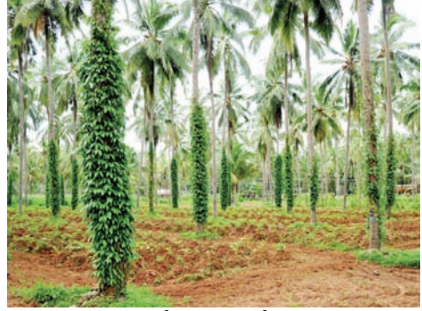
ಜ. ಲೋಂಗ್ ಪೆಪ್ಪರ್