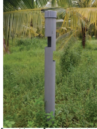
ಮೋಹಕ ನ್ಯಾನೋ ಮ್ಯಾಟ್ರಿಕ್ಸ್ ಬಲೆ