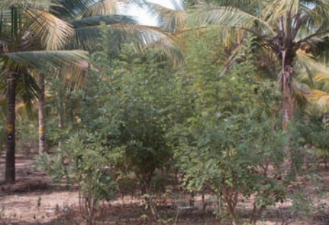
ಚಿತ್ರ 3. ಗ್ಲಿರಿಸೀಡಿಯ ಎಡೆ ಬೆಳೆ

25 ರಷ್ಟು ರಂಜಕ ಹಾಗೂ 15 ರಷ್ಟು ಪೊಟ್ಯಾಷ್‌ನ್ನು ಒದಗಿಸಿದಂತಾಗುತ್ತದೆ. ಇದಲ್ಲದೇ ಪೋಷಕಾಂಶಗಳು ನಿಧಾನವಾಗಿ ತೆಂಗಿಗೆ ಲಭ್ಯವಾಗುವುದರ ಜೊತೆಗೆ ಮಣ್ಣಿನ ನೀರು ಹಿಡಿದಿಟ್ಟುಕೊಳ್ಳುವ ಸಾಮರ್ಥ್ಯವು ವೃದ್ಧಿಯಾಗುತ್ತದೆ. ಮರಳು ಮಿಶ್ರಿತ ಮಣ್ಣಿನಲ್ಲಿ ಶೇ.44ರಷ್ಟು ಅಧಿಕ ಇಳುವರಿಯನ್ನು ಶೇ.50 ರಷ್ಟು ಗ್ಲಿರಿಸೀಡಿಯಾ ಬೆಳೆಯುವುದರಿಂದ ಪಡೆಯಲಾಗಿದೆ.