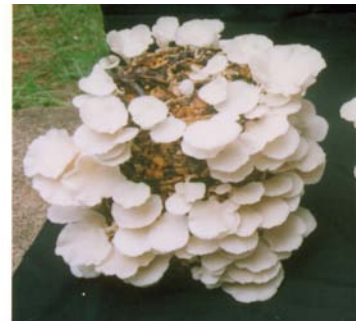
ಚಿತ್ರ 33. ತೆಂಗಿನ ತ್ಯಾಜ್ಯ ವಸ್ತುಗಳಿಂದ ಅಣಬೆ ಕೃಷಿ

ಬೆಳೆ ನಿರ್ವಹಣೆ ಬೀಜಾಣುಗಳನ್ನು ಸೇರಿಸಿದ ಚೀಲವನ್ನು ಅಣಬೆ ಬೆಳೆಸುವ ಕೋಣೆಯಲ್ಲಿಡಬೇಕು. ಕಡಿಮೆ ವೆಚ್ಚದ ಅಣಬೆ ಬೆಳೆಸುವ ಕೊಠಡಿಯನ್ನು ತೆಂಗಿನ ಕಾಂಡ ಮತ್ತು ಹೆಣೆದ ಎಲೆಗಳನ್ನು ಉಪಯೋಗಿಸಿ ತೆಂಗಿನ ತೋಟದಲ್ಲೇ ಕಟ್ಟಬಹುದು. ತೆಂಗಿನ ತುಂಡುಗಳಿಂದಲೇ ಕೊಠಡಿಯೊಳಗೆ ಅಟ್ಟಳಿಗೆಗಳನ್ನು ಹಾಕಿ ಚೀಲಗಳನ್ನು ಇರಿಸಬಹುದು. ಅಟ್ಟಳಿಗೆಯ ಮೇಲೆ ನದಿ ತೀರದ ಮರಳನ್ನು ಹರಡಬೇಕು. ಅಟ್ಟಳಿಗೆಯ ಬದಿಗಳಿಗೆ ಗೋಣಿ ಚೀಲಗಳನ್ನು