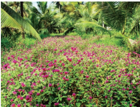
ಕ. ಗೋಂಪ್ರೀನಾ ಹೂಗಳು