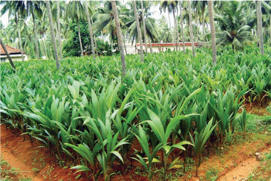
ಚಿತ್ರ 1. ಉತ್ತಮ ಗುಣಮಟ್ಟದ ಸಸಿಗಳು

ಯಾವುದೇ ತೆಂಗಿನ ತೋಟದಲ್ಲಿ ಉತ್ತಮವಾದ ಇಳುವರಿ ಪಡೆಯುವಲ್ಲಿ, ಸಸಿ ಮಡ್ಡಿಯಲ್ಲಿನ ಉತ್ತಮವಾದ ಸಸಿಯ ಆಯ್ಕೆ ಪ್ರಮುಖ ಪಾತ್ರ ವಹಿಸುತ್ತದೆ. ಎತ್ತರದ ತಳಿಗಳಿದ್ದಲ್ಲಿ, ಒಂದು ವರ್ಷದ, 5-6 ಎಲೆಗಳನ್ನು ಹೊಂದಿದ, ಬುಡದ ಸುತ್ತಳತೆ 10 ಸೆ.ಮೀ. ನಷ್ಟು ಇರುವ ಹಾಗೂ ಶೀಘ್ರವಾಗಿ ಎಲೆಗಳು ಸೀಳಿರುವ ಸಸಿಗಳನ್ನು ಆಯ್ಕೆ ಮಾಡಬೇಕು (ಚಿತ್ರ 1). ಗಿಡ್ಡ ತಳಿಗಳಲ್ಲಿ, ಬುಡದ ಸುತ್ತಳತೆ 8 ಸೆ.ಮೀ. ನಷ್ಟಿರುವ ಹಾಗೂ 80 ಸೆ.ಮೀ ಎತ್ತರವಿರುವ ಸಸಿಗಳನ್ನು ಆಯ್ಕೆ ಮಾಡಬೇಕು. ನೀರು ಹಿಡಿದಿಟ್ಟುಕೊಳ್ಳುವ ತಗ್ಗು ಪ್ರದೇಶಗಳಿಗಾಗಿ 1½-2 ವರ್ಷದ ಸಸಿಗಳನ್ನು ಆಯ್ಕೆಮಾಡಬೇಕು.