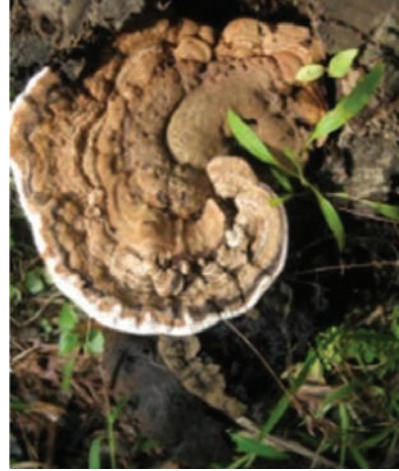
ಚಿತ್ರ 24. ಅಣಬೆ ರೋಗ ಬಾಧಿತ ಮರ