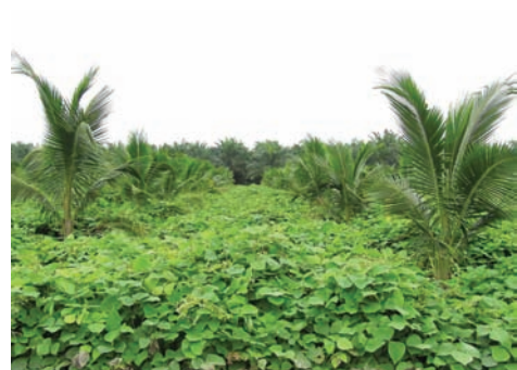
ಡ. ಮುಕುನಾ ಅಂಗಿಕ್ಯುಲೇಟಾ