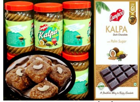
ಚಿತ್ರ 32. ಪಾನೀಯ ಚಾಕೋಲೇಟ್,

ತೆಂಗಿನ ಸಕ್ಕರೆಯಿಂದ ಇನ್ನೂ ಹಲವಾರು ಮೌಲ್ಯವರ್ಧಿತ ಉತ್ಪನ್ನಗಳನ್ನು ತಯಾರಿಸುವ