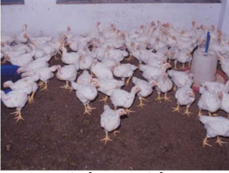
ಸ. ಕೋಳಿ ಸಾಕಣೆ