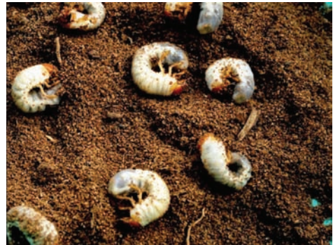
ಚಿತ್ರ 17. ತೆಂಗಿನ ಬೇರು ತಿನ್ನುವ ಹುಳು