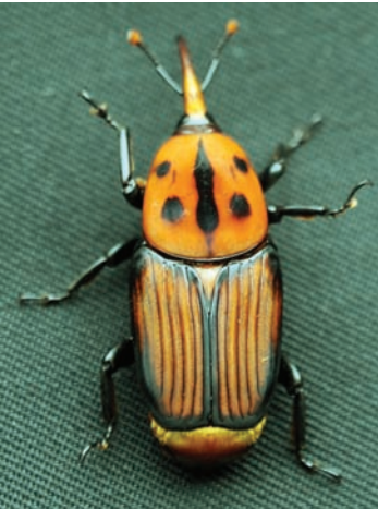
ಚಿತ್ರ 14. ಕೆಂಪು ಮೂತಿ ದುಂಬಿ

ಕೀಟವು ತೆಂಗಿನ ಮರದ ಮೃದುವಾದ ಅಂಗಾಂಶ, ಸುಳಿಭಾಗ ಹಾಗೂ ಹತ್ತಿರದ ಕಾಂಡಕ್ಕೆ ದಾಳಿವಾಡುತ್ತದೆ. ಇದರ ದಾಳಿಯಿಂದಾಗಿ ಕಾಂಡದಲ್ಲಿ ರಂಧ್ರಗಳು ಕಾಣಿಸಿಕೊಂಡು ಅವುಗಳಿಂದ ಕಂದು ಬಣ್ಣದ ನಾರಿನಂತಹ ಪದಾರ್ಥ ಹೊರಸೂಸುತ್ತದೆ (ಚಿತ್ರ 14). ಮರಿ ಹುಳುಗಳು ಸುಳಿಭಾಗ ತಿನ್ನುವುದರಿಂದ ಮರ ಸಾಯುತ್ತದೆ. ತಿರಿಭಾಗದ ಎಲೆಗಳು ಒಣಗುತ್ತವೆ ಮತ್ತು ಸುಳಿಯು ಸೊರಗಿ ಅದರ ಬುಡ ಭಾಗ ಉದ್ದುದ್ದವಾಗಿ ಸೀಳಿಕೊಳ್ಳುವುದರ ಜೊತೆಗೆ