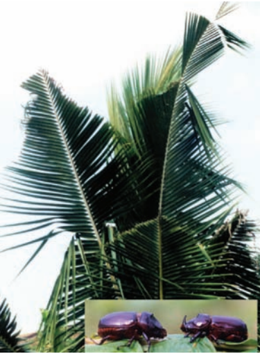
ಚಿತ್ರ 13. ಕುರುವಾಯಿ ದುಂಬಿ ಬಾಧಿತ ಮರ

ಒಟ್ಟು 39 ಜಾತಿಯ ಕಪ್ಪು ದುಂಬಿ ಕೀಟಗಳನ್ನು ಕಾಣಬಹುದು ಆದರೆ ಇದರಲ್ಲಿ ಕೆಲವು ಮಾತ್ರ ತೆಂಗಿನ ಬೆಳೆಗೆ ಬಾಧಿಸುತ್ತವೆ. ವರ್ಷ ಪೂರ್ತಿ ಈ ಕೀಟವಿರುವುದು, ಆದರೆ ಅದರ ತೀವ್ರತೆಯು ಜೂನ್ ನಿಂದ ಸೆಪ್ಟೆಂಬರ್ ವರೆಗೆ ಇರುತ್ತದೆ. ಈ ತಿಂಗಳುಗಳಲ್ಲಿ ಪ್ರೌಢ ಕೀಟವು ತೆಂಗಿನ ಸುಳಿಯನ್ನು ಪ್ರವೇಶಿಸುತ್ತದೆ.