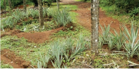
ಚಿತ್ರ 9. ಅರ್ಧ ಚಂದ್ರಾಕಾರದ ಬದು

ಅರ್ಧ ಚಂದ್ರಾಕಾರದ ಬದುವನ್ನು ತೆಂಗಿನ ಬುಡದಿಂದ 2 ಮೀ. ದೂರದಲ್ಲಿ ಇಳಿಜಾರು ಪ್ರದೇಶದಲ್ಲಿ ಒಂದು ಅಡಿ ಅಗಲದಷ್ಟು ನಿರ್ಮಿಸಬೇಕು (ಚಿತ್ರ 9).