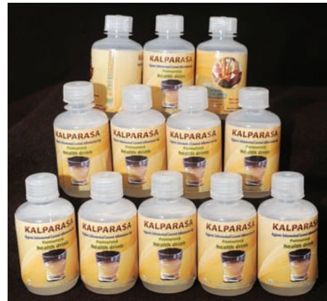
ಚಿತ್ರ 30. ಸಿ.ಪಿ.ಸಿ.ಆರ್.ಐ. ತಂತ್ರಜ್ಞಾನ