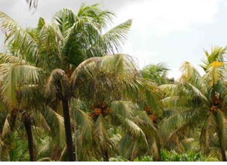
ಚಿತ್ರ 20. ಬೇರು (ಸೊರಗು) ರೋಗ ಬಾಧಿತ ಮರ