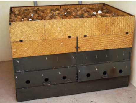
ಚಿತ್ರ 25. ಚಿಪ್ಪುಗಳನ್ನು ಇಂಧನವಾಗಿ ಬಳಸುವ ಕೊಬ್ಬರಿ ಡ್ರೈಯರ್