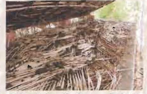
बड़े पैमाने में वर्मीकंपोस्ट बनाने के लिए 10:2 अनुपात में नारियल पत्ते और गोबर सीमेंट टंकी में भरे