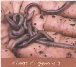
केंरोफअस की यूज़िलस जाति

केंचुओं का संवर्द्धन और बड़े पैमाने पर वर्मीकंपोस्ट उत्पादन।