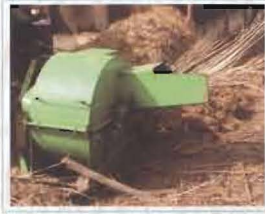
बायोश्रेडर मशीन से नारियल पत्तों को चूरा करना