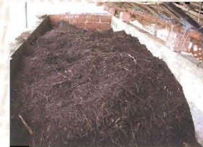
नारियल पत्ता वर्मीकंपोस्ट