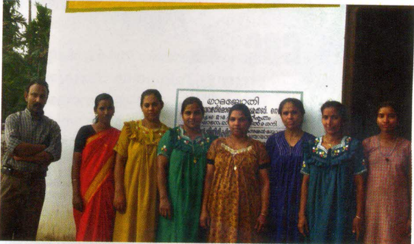
കമ്പോസ്റ്റ് യൂണിറ്റിലെ അംഗങ്ങൾ