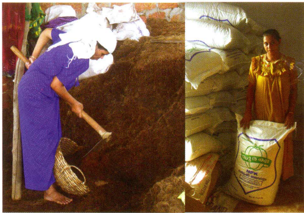
കമ്പോസ്റ്റ് ശേഖരിക്കുന്നു പായ്ക്ക് ചെയ്ത കമ്പോസ്റ്റ്

സ്വാശ്രയസംഘങ്ങളുടെ ഫെഡറേഷനാണ്. നാളികേര ഉൽപന്നങ്ങളുടെ ഉൽപാദനവും വിപണനവുമായി ബന്ധപ്പെട്ട പ്രവർത്തനങ്ങളിൽ ഇതിലെ 7000 അംഗങ്ങൾ ഏർപ്പെട്ടിരിക്കുന്നു. സുഭിക്ഷ നാൽപ്പത്തിയൊന്നോളം മുല്യവർദ്ധിത നാളികേരോൽപന്നങ്ങൾ ഉൽപാദിപ്പിച്ച് വിപണനം ചെയ്യുന്നുണ്ട്. സുഭിക്ഷയുടെ വാർഷിക വിറ്റുവരവ് 43.75 കോടി രൂപയും വാർഷിക ആദായം 16.68 കോടി രൂപയുമാണ്. ഒരു കുടുംബത്തിന് 25140 രൂപ വാർഷിക വരുമാനം പ്രതീക്ഷിക്കുന്നു.