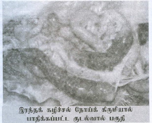
இரத்தக் கழிச்சல் நோய்க் கிருமியால் பாதிக்கப்பட்ட குடல்வால் பகுதி