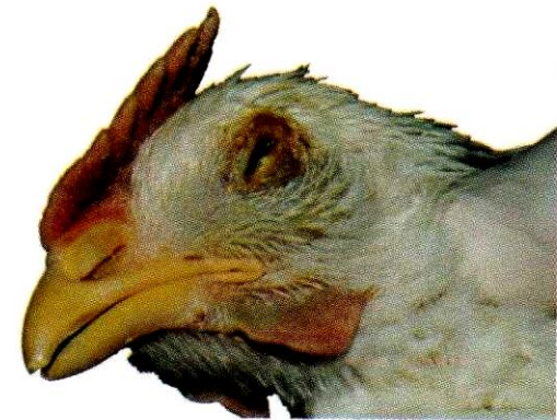
ରାଶୀକ୍ଷେତ ରୋଗର ଲକ୍ଷଣ- ମୁଣ୍ଡ ମୋଡ଼ିକି ବସିବା, ଆଖି ଚାରିପାଖରେ ଫୁଲିବା

ଲ- କୋଲି ଓ ଶ୍ୱାସକ୍ରିୟା ଜନିତ ରୋଗ: ଏହି ରୋଗରେ ପଡ଼ିକି କୁକୁଡ଼ା ମାନେ ପତଳା ଝାଡ଼ା ହେବା ସହ ଶ୍ୱାସକ୍ରିୟାରେ କଷ୍ଟ ଅନୁଭବ କରନ୍ତି ଓ ମରିଯାନ୍ତି । ଯଦି କୁକୁଡ଼ା ଅଣ୍ଡା ଦେଉଥାନ୍ତି ତେବେ ତାଙ୍କର ଅଣ୍ଡା ଉତ୍ପାଦନ କମିଯାଏ ଓ ପତଳା ଖୋଳପା କିମ୍ବା ଫଟା ଖୋଳପା ଯୁକ୍ତ ଅଣ୍ଡା ଦିଅନ୍ତି ।