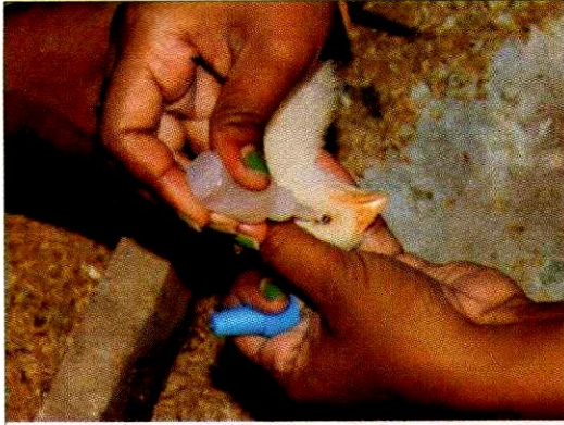
କୁକୁଡ଼ାଙ୍କୁ ଟୀକା କାରଣ

ସଠିକ ସମୟରେ ଟୀକା କାରଣ କରିବା, ଖାଦ୍ୟରେ ତଥା ପାଣିରେ ଆଣ୍ଟି ବାୟୋଟିକ ଦେବା ଓ ପରଜୀବୀ ନରୋଧକ କୁକୁଡ଼ା କୁ ଦେଇ ଏହି ମାରାତ୍ମକ ରୋଗରୁ କୁକୁଡ଼ାଙ୍କୁ ରକ୍ଷା କରିପାରିବା ।