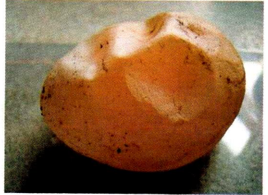
ପତଳା ଖୋଳପା ଅଣ୍ଡା

ଲ- କୋଲି ଓ ଶ୍ୱାସକ୍ରିୟା ଜନିତ ରୋଗ: ଏହି ରୋଗରେ ପଡ଼ିକି କୁକୁଡ଼ା ମାନେ ପତଳା ଝାଡ଼ା ହେବା ସହ ଶ୍ୱାସକ୍ରିୟାରେ କଷ୍ଟ ଅନୁଭବ କରନ୍ତି ଓ ମରିଯାନ୍ତି । ଯଦି କୁକୁଡ଼ା ଅଣ୍ଡା ଦେଉଥାନ୍ତି ତେବେ ତାଙ୍କର ଅଣ୍ଡା ଉତ୍ପାଦନ କମିଯାଏ ଓ ପତଳା ଖୋଳପା କିମ୍ବା ଫଟା ଖୋଳପା ଯୁକ୍ତ ଅଣ୍ଡା ଦିଅନ୍ତି ।