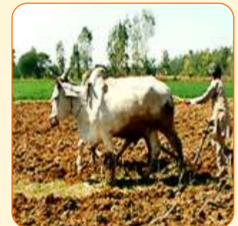
भूमि की जुताई