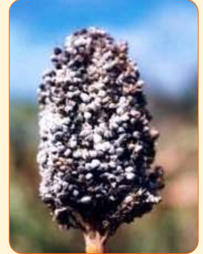
ग्रेन मोल्ड बाधित भूटा