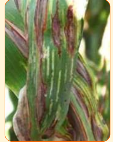
डाउनी मिलड्यु संक्रमित पत्तियां