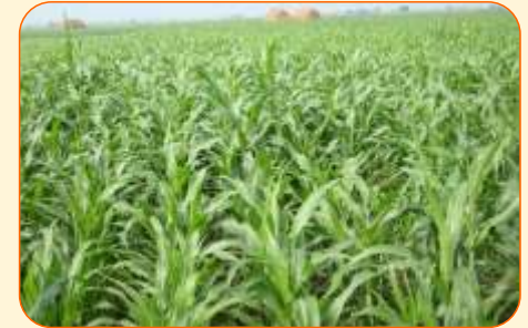
खरपतवार मुक्त फसल