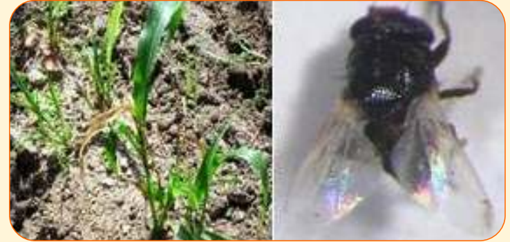
प्ररोह मक्खी प्रकोप