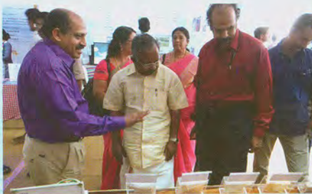
Visitors at ICAR-CIFT stall at Kollam कोल्लम में भा कृ अनु प-के मा प्रौ सं स्टाल में आगंतुक