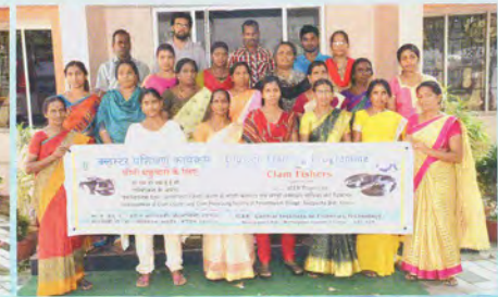
Participants of the second day दूसरे दिन के प्रतिभागी