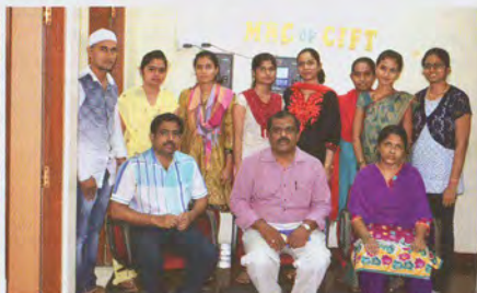
Participants and faculty of training at Mumbai मुंबई में प्रशिक्षण के प्रतिभागियों और संकाय