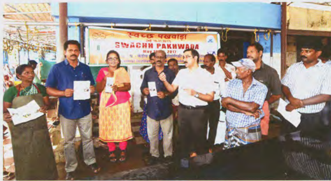
Release of pamphlet पुस्तिका का विमोचन

released the pamphlet "Matsya markettukalil vrithiyum shuchithvavum engine paripalikkam?" (How to keep fish markets neat and clean?) and spoke about the importance of hygiene in market places and its effect on public health. Demonstration on Fish De-scaler Machine was also made for the benefit of fish vendors. Hygiene kit were also distributed to the fish vendors. The programme generated immense curiosity among fish vendors and public alike and concluded with a scientist-fish vendor interaction on various issues faced by fish vendors.