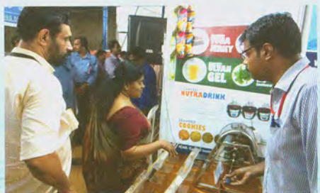
Smt. J. Mercy Kutty Amma, Hon'ble Minister for Fisheries showing interest in fish descaling machine at Kollam श्रीमती जे. मेर्सी कुट्टी अम्मा, माननीय मात्स्यकी मंत्री कोल्लम में मत्स्य डीस्केलिंग मशीन में दिलचस्पी दिखाना