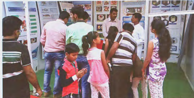
Karshika Mela at Motihari, Bihar मोतीहारी, बिहार में किसान मेला