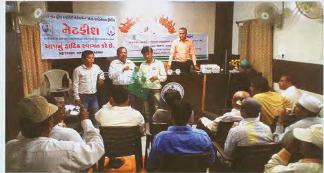
Technical session in progress at Diu and Porbandar

दीव और पोरबंदर में तकनीकी सत्र प्रगति पर है