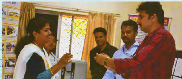
Open house ओपन हाउस