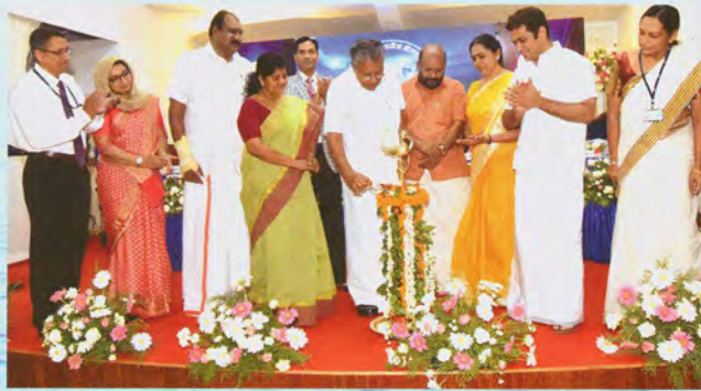
Inauguration of Diamond Jubilee celebration function by Hon'ble Chief Minister

At ICAR-CIFT, Kochi: The Diamond Jubilee Foundation Day function was inaugurated by Shri Pinarayi Vijayan, Hon'ble Chief Minister of Kerala in gracious presence of Smt. J. Mercy Kutty Amma, Hon'ble Minister of Fisheries, Harbour Engineering and Cashew Industry, Govt. of Kerala; Adv. V.S. Sunil Kumar, Hon'ble Minister for Agriculture; Dr. Trilochan Mohapatra, Secretary, DARE, GoI & Director General, ICAR, New Delhi and other galaxy of dignitaries on the dais which included Smt. Soumini Jain, Worshipful Mayor of Cochin Municipal Corporation, Shri K.J. Maxy, MLA, Kochi and Shri Hibi Eden, MLA, Ernakulam. Welcoming the gathering, Dr. Ravishankar