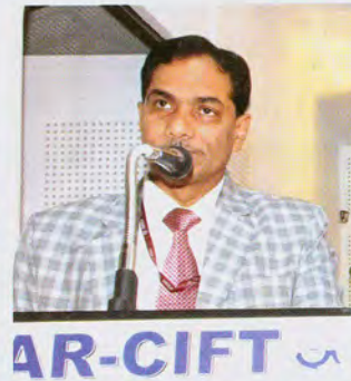
Keynote address by