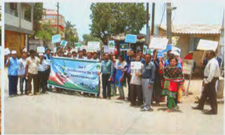
Rally by staff of ICAR-CIFT and ICAR- CMFRI

भा कृ अनु प-के मा प्रौ सं और भा कृ अनु प- के स मा अनु सं के कर्मचारियों द्वारा पौधा रोपण