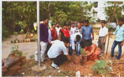
Planting of saplings by staff of ICAR-CIFT and ICAR-CMFRI

भा कृ अनु प-के मा प्रौ सं और भा कृ अनु प- के स मा अनु सं के कर्मचारियों द्वारा पौधा रोपण