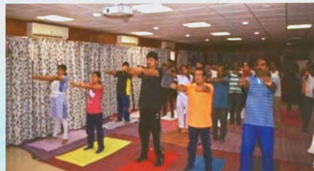
Mass yoga demonstration in progress