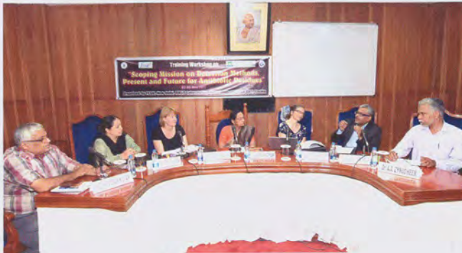
Meeting in progress प्रगति में बैठक

present during the programme. Scientists from various Divisions and representatives from EIA, Kochi attended the programme.