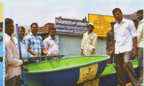
Distribution of FRP coracle

मूल्यवर्धित मत्स्य उत्पादों पर प्रशिक्षण