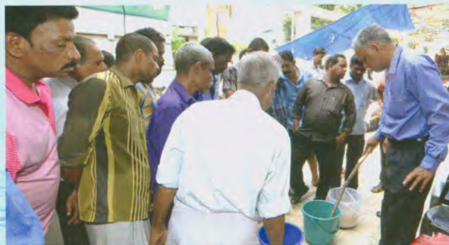
Demonstration on preparation of silage from fish waste and descaling machine operation

On 16 May, 2017 a demonstration on preparation of silage from fish waste was organized at Thoppampady fish market for the benefit of around 20 retail fish vendors. Dr. A.A. Zynudheen, Principal Scientist demonstrated how