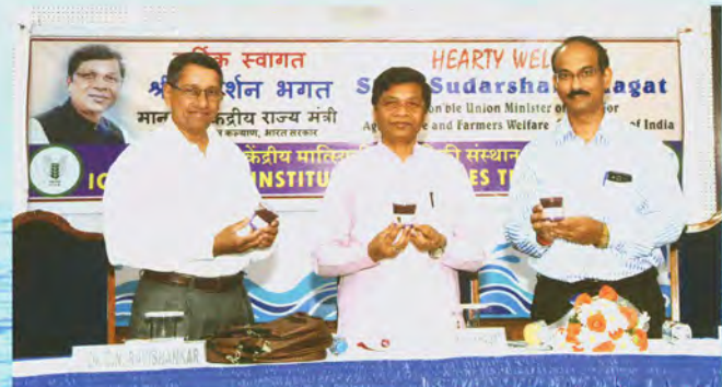
Launching of 'Nutridrink'