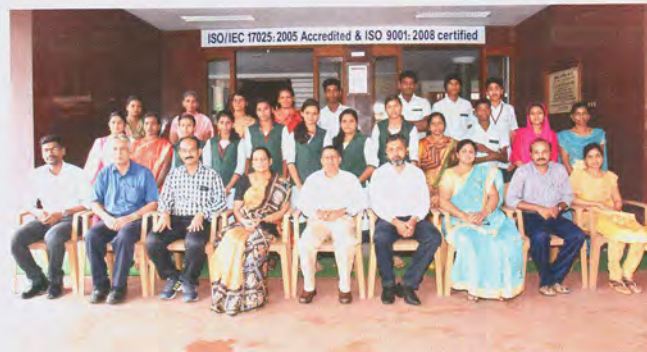
Participants with faculty of the programme