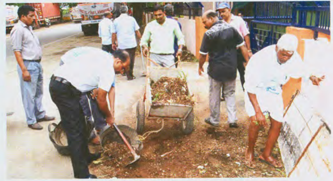
Cleanliness drive in progress सफाई अभियान कार्य प्रगति पर

स्वच्छ पखवाड़ा : स्वच्छ भारत अभियान पर भारत सरकार की पहल के अनुसार भा कृ अनु प-के मा प्रौ सं, कोच्चि में स्वच्छ पखवाड़े की गतिविधियां 16 मई, 2017 को शुरू की गईं। इस कार्यालय में यह पाक्षिक समारोह 16 मई, 2017 को एक प्रतिज्ञा के साथ शुरू किया गया। निदेशक, भा कृ अनु प-के मा प्रौ सं कार्यालय परिसर और प्रयोगशाला सुविधाओं को साफ रखने की जरूरत पर बल दिया और यह भी अनुरोध किया कि पखवाड़े बारे के समारोह में सभी कर्मचारियों भाग लेकर इस स्वच्छ पखवाड़े को शानदार सफलता प्रदान करें। संस्थान में प्रतिज्ञा के बाद एक सफाई अभियान आयोजित किया गया। संस्थान के सभी कर्मचारी और वैज्ञानिक इस सफाई अभियान में भाग लिए।