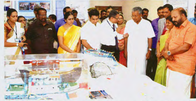
Director explaining the technologies to the dignitaries

निदेशक गणमान्य व्यक्तियों को प्रौद्योगिकियों को समझाते हुए