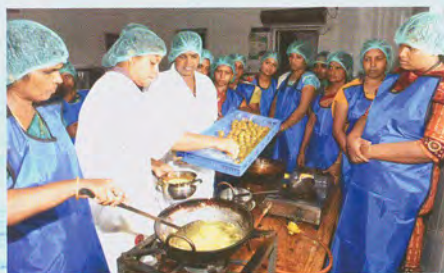
Training in progress प्रगति में प्रशिक्षण