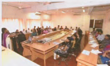
Training on HACCP concepts at Kochi कोच्चि में एचएसीसीपी अवधारणाओं पर प्रशिक्षण