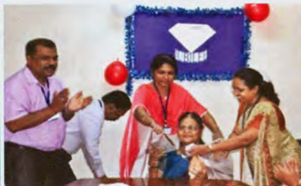
Honoring of retired staff