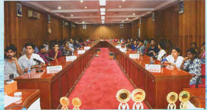
Quiz in progress प्रश्नोत्तरी प्रगति में