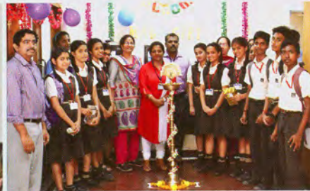
Students during Open house