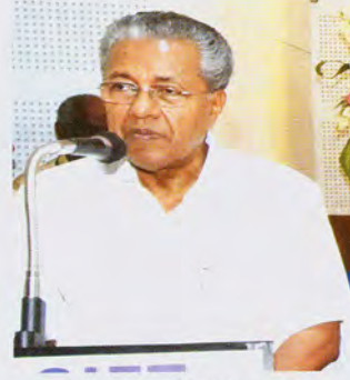
Inaugural Address by Shri Pinarayi Vijayan