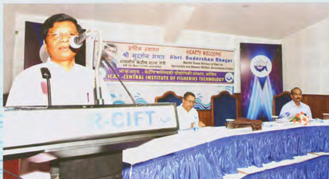
Shri Sudarshan Bhagat addressing the staff

During his visit to different laboratories, Shri Sudarshan Bhagat expressed satisfaction over the research progress of ICAR-CIFT in responsible fishing, energy efficient vessel design, value added fish product development, quality maintenance and safety standards development to address the emerging issues in the sector. On the occasion, Hon'ble Minister also launched some newly developed fish products namely; Collagen Peptide Biscuits, Seaweed Nutri Drink, Calcium and Iron Fortified Fish Soup Powder and an E-Book entitled "Mechanized Fishing Vessels of India". The programme came to an end with vote of thanks offered by Dr. A.K. Mohanty, Head, Extension, Information and Statistics Division. All the Scientists and other staff of the Institute attended the programme and made it a grand success.