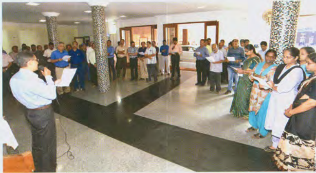
Director administering the pledge निदेशक महोदय द्वारा प्रतिज्ञा दिलाना

'Swatch Pakhwada': As per Government of India's initiative on 'Swachh Bharat Abhiyan', Swachh Pakhwada activities were initiated at ICAR-CIFT, Kochi on 16 May, 2017. The fortnightly celebrations started with a pledge on 16 May, 2017 at the office. The Director, ICAR-CIFT stressed upon the need to keep office premises and lab facilities clean and also requested all staff to participate in the fortnight-long celebrations to make Swachh Pakhwada a grand success. Following the pledge a cleanliness drive was organized at the Institute. All the staff and scientists of the Institute participated in the cleanliness drive.