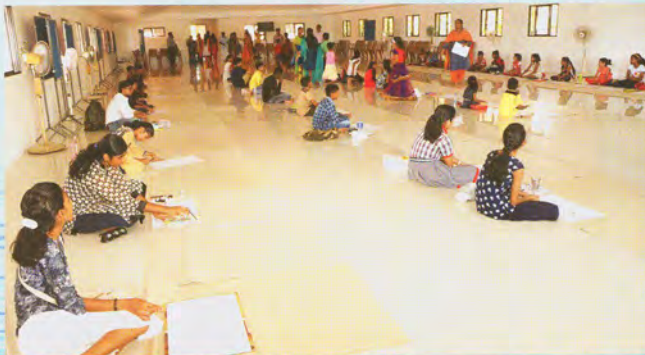
Painting in progress प्रगति में चित्रकारिता

कोच्चि में चित्रकारी और प्रश्नोत्तरी प्रतियोगिता: हीरक जयंती समारोह के उपलक्ष्य में विद्यालय के छात्रों के लिए एक चित्रकला प्रतियोगिता 28 अप्रैल, 2017 को आयोजित की गई। दोपहर में, कॉलेज के छात्रों के लिए एक प्रश्नोत्तरी प्रतियोगिता भी आयोजित की गई। विजेताओं को प्रमाण पत्र और नकद पुरस्कार प्रदान किए गए।