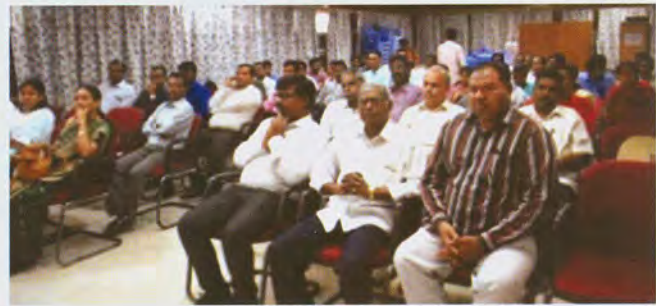
Section of audience कुछ दर्शक