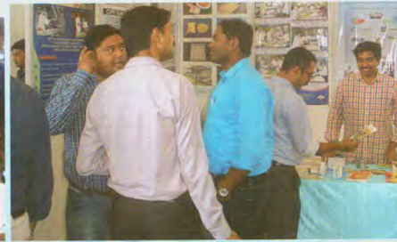
Exhibition held at ICAR-NBFGR, Lucknow आईसीएआर-एनबीएफजीआर, लखनऊ में आयोजित प्रदर्शनी