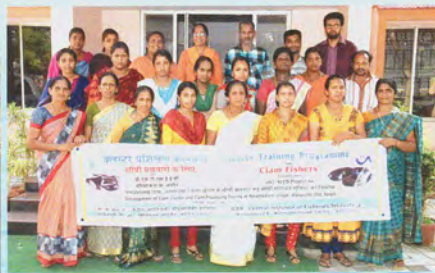
Participants of the first day पहले दिन के प्रतिभागी