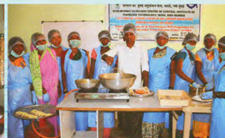
Training on value added fish products

मूल्यवर्धित मत्स्य उत्पादों पर प्रशिक्षण