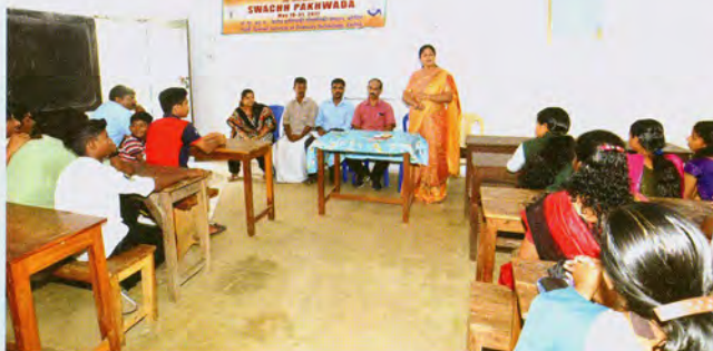
Awareness programme at Kadamakudy village