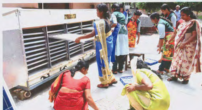
Training in progress