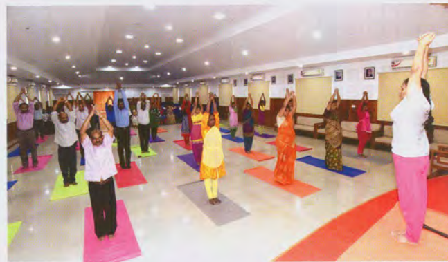
Mass Yoga performance in progress