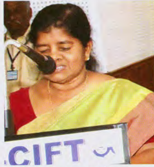
Presidential Address by Smt. J. Mercy Kutty Amma

श्रीमती जे. मेर्सी कुट्टी अम्मा द्वारा अध्यक्षीय भाषण