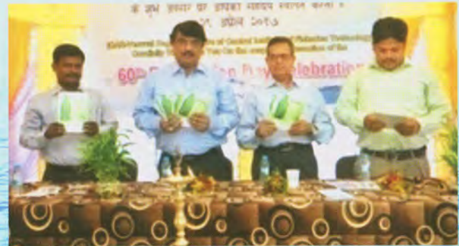
Release of publications

डॉ. जी.के. शिवरामन अध्यक्षीय भाषण प्रदान करना