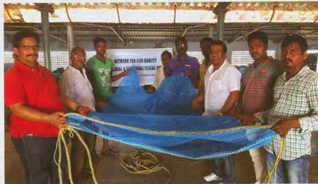
Training on Fabrication of square mesh codend in progress

वर्ग मेश कोडएन्ड संरचना पर प्रशिक्षण कार्य प्रगति में