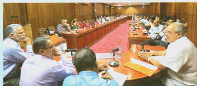
Interface Meet in progress इंटरफेस बैठक में प्रगति

में व्यापार ऊष्मायन नवीनतम वैज्ञानिक सफलताओं और अनुसंधान एवं विकास सुविधाओं की मदद से मत्स्य क्षेत्र में उद्यमशीलता को बढ़ावा देने के लिए बनाया गए ड्राइव के भाग के रूप आयोजित की गई। इस कार्यक्रम में संस्थान की प्रौद्योगिकिया संपत्ति की विशेष तकनीकी और पैनल परिचर्चाओं इन सत्रों में शामिल थे। इस कार्यक्रम में अनुसंधान एवं विकास से कई जमीनी स्तर उद्यमियों, शुरू हुआ कंपनियों, निर्यातकों, आयातकों, अनुसंधान एवं विकास और शिक्षा संस्थानों के विशेषज्ञ भाग लिए।