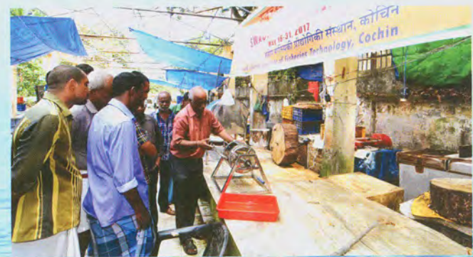
Demonstration on fish descaling machine