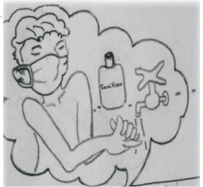
मास्क तथा सैनीटाइजर

मछुआरों को छोटे समूहों में काम करना चाहिए; जब भी वे अपने घर से किसी भी मत्स्ययन कार्य के लिए बाहर निकले तब उन्हें सुरक्षात्मक मास्क/ कवर पहनना चाहिए और थोड़े- थोड़े अंतराल पर अपने हाथों को बार-बार साबुन से धोना चाहिए। साथ ही, उन्हें 1 से 1.5 मीटर की सामाजिक दूरी बनाए रखनी चाहिए। उत्पादित मछलियों को संभालने और पैक करने के दौरान दस्ताने का उपयोग करने की सलाह दी जाती है। संदिग्ध या विषाणु वाहक व्यक्तियों से बचाव के लिए केवल स्वस्थ व्यक्तियों को कार्य में सम्मिलित करें।