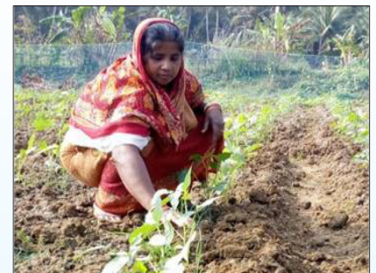
Vegetable cultivation along the pond dykes