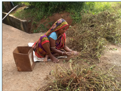
Manual stripping of groundnut pods