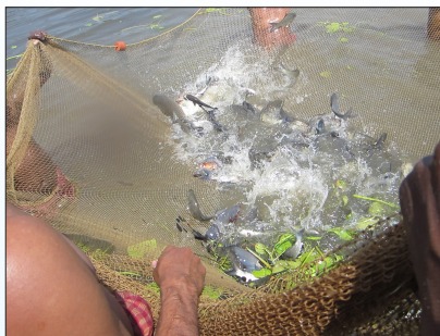
Harvest of Indian Major Carps

था। तालाब के चारों ओर ट्रेलिस प्रणाली से औसतन 174 कि.ग्रा. सब्जियां प्राप्त की गईं तथा इनसे होने वाली मासिक आय 6,419/- रु. थी (0.08-0.22) हैक्टर तालाब क्षेत्र से) 12 मि.मी. जाली आकार के गलफड़ा जाल का उपयोग करके एसआईएफएस का नियमित द्विसप्ताहिक प्रग्रहण किया जा रहा है जिससे 200-750 ग्रा. औसत प्राप्ति हो रही है। प्रग्रहण किए गए एसआईएफएस का उपयोग पूरी तरह घरेलू उपभोग में किया जा रहा है। तालाबों तथा नहरों से एसआईएफएस के प्रग्रहण हेतु देसी बक्सा प्रकार के मछली फंदों पर परीक्षण किए गए। इन बक्सा फंदों का उपयोग करके एक अवधि में औसतन 1.5 कि.ग्रा. एसआईएफएस का प्रग्रहण हुआ।