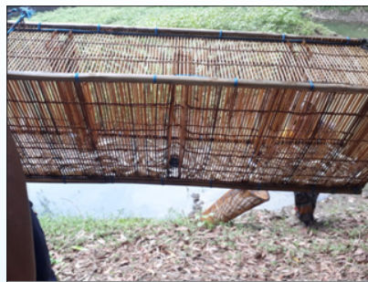
Harvesting of SIFFS using box traps