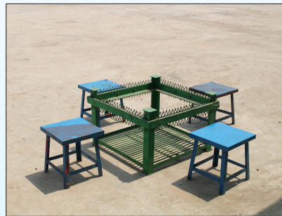
Manual Groundnut Stripper