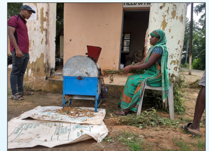
Stripping of the pods with developed power operated groundnut stripper