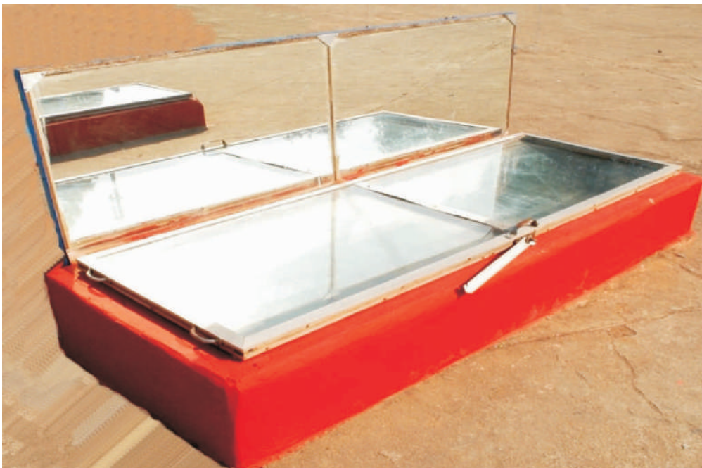
चित्र 2: पशु आहार सौर चूल्हा