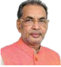
राधा मोहन सिंह RADHA MOHAN SINGH