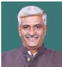
गजेन्द्र सिंह शेखावत