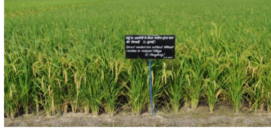
धान की सीधी बुआई कम जुताई में करने पर 50 प्रतिशत जुताई की बचत

अधिक जानकारी के लिए किसान केंद्रीय मृदा लवणता अनुसंधान संस्थान में संपर्क कर सकते हैं। उनका मार्गदर्शन किया जाएगा।