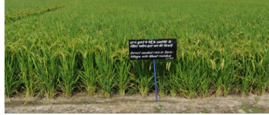
धान की सीधी बुआई जीरो टिलेज में गेहूँ के अवशेषों के साथ करने से 29 – 35 प्रतिशत सिंचाई जल की बचत