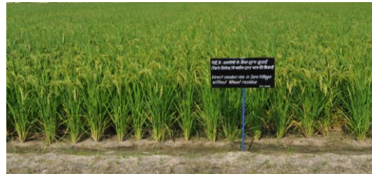
धान की सीधी बुआई जीरो टिलेज में गेहूँ के अवशेषों के बिना करने से 29 – 35 प्रतिशत सिंचाई जल एवं जुताई की बचत