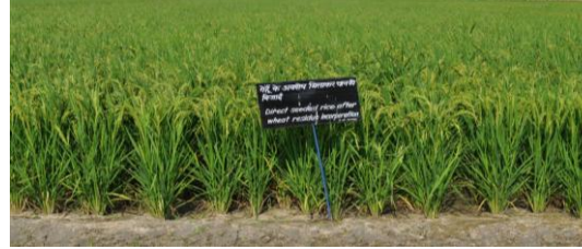
धान की सीधी बुआई गेहूँ के अवशेष मिलाकर, कम जुताई से मृदा कार्बन वृद्धि के साथ 50 प्रतिशत जुताई की बचत