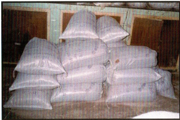
அடுக்கி வைக்கப்பட்ட தீவன மூட்டைகள்

தீவனத்தில் காளான் மணம் வரும். அதிக அளவில் தீவனம் வாங்குவதையோ, அதிக நாட்கள் இருப்பு வைப்பதையோ தவிர்க்க வேண்டும். ஒரு மாதத்திற்குரிய தீவனத்தை மட்டும் ஒரே சமயத்தில் வாங்குதல் போதுமானது. தீவனப்பையை திறந்து வைத்தல் கூடாது. தீவனப்பை திறந்து இருந்தால், தீவனத்தில் ஈரம்பட்டு கெட்டு போய்விடும். ஒன்றின் மேல் ஒன்றாக தீவன மூட்டைகளை சரியாக அடுக்கி வைத்தல் வேண்டும்.