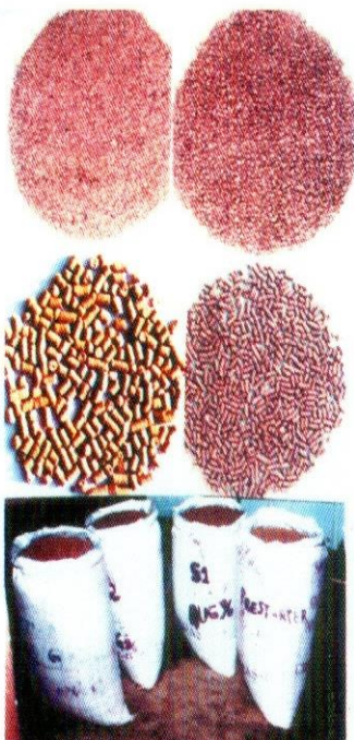
இரால் தீவன வகைகள்

இலாபகரமான மற்றும் வெற்றிகரமான இரால் வளர்ப்புக்கு முறையான தீவன மேலாண்மை இன்றியமையாதது. தீவனங்கள் கொடுத்து இரால்களை வளர்க்கும்போது குளத்தின் சுகாதார பராமரிப்பை கருத்தில் கொள்ள வேண்டும். மேம்பட்ட தீவன மேலாண்மை மூலமே இரால் வளர்ச்சி குன்றாமலும், குளத்தின் தூய்மை பாதிக்கப்படாமலும் பாதுகாக்க முடியும். சிறந்த தீவன மேலாண்மை மூலம் அளவோடு உணவு இட்டு, அதன் மூலம் தீவனச் செலவுகளை குறைத்து, குளத்தின் அடிப்பகுதியில் எஞ்சிய தீவனம் திரண்டு தூய்மைக்கேடு உண்டாவதையும் தவிர்க்க வழிவகுக்க முடியும்.